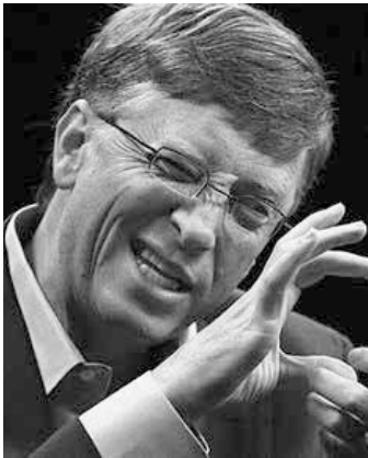
Understandably: "Bill Gates Says This 1 Intense Habit Separates Highly Successful People From Those Who Only Dream" < https://www.linkedin.com/pulse/bill-gates-says-1-intense-habit-separates-highly-from-bill-murphy-jr- >

der ligger meget langt fra hans offentlige udmeldinger.