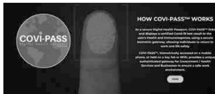
Foto: screenshot The Last American Vagabond : „Your “Immunity Passport” Future Begins To Materialize As Airlines Call For Digital ID Tracking Systems” < https://www.thelastamericanvagabond.com/your-immunity-passport-future-begins-to-materialize-as-airlines-call-for-digital-id-tracking-systems/ >

The Gates Foundation har bestyrelsesposter ikke bare i GAVI, men også i Global Fund, Partnership for Maternal, Newborn and Child Health, the Medicines for Malaria Venture, the Roll Back Malaria Partnership, the TB Alliance, the Stop TB Partnership og mange flere.