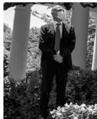
Foto: Moncef Slaoui lytter mens Gustave Perna, kommanderende general i U.S. Army Material Command, kommer med bemærkninger under en update om vaccine udviklingen. 15 maj, 2020, i the Rose Garden of the White House.

Som The Last American Vagabond rapporterede[15], har Donald Trump også udpeget dr. Moncef Slaoui – en tidligere "Big Pharma"-chef, der indtil for nylig sad i bestyrelsen i Moderna – til den "vaccine-tzar", der skal lede "Operation Warp Speed," - hvilket er Trump-administrationens indsats for hurtigt at udvikle en vaccine inden slutningen af 2020. I 2016 blev Slaoui udpeget til at sidde i Moderna Therapeutics' bestyrelse[16]. Han trådte tilbage, efter han blev udpeget til en position i den nuværende amerikanske regering.