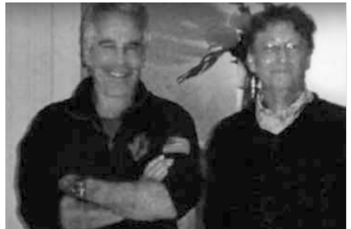
Foto: screenshot YouTube: DelCarajoTV: "La Historia oculta de Bill Gates que nadie se atreve a contar: Es amigo de Jeffrey Epstein... 14.06.2020" < https://www.youtube.com/watch?v=c3vB0Dhet2E >

The Guardian skriver også, at Rockefeller, Gates og Buffet organiserede mødet. The Wall Street Journal rapporterede[41], at mødet handlede om at sænke befolkningstilvæksten, en eufemisme for eugenik-tilhængere. Ted Turners deltagelse i mødet både i 2001 og i 2010 burde ikke overraske nogen,