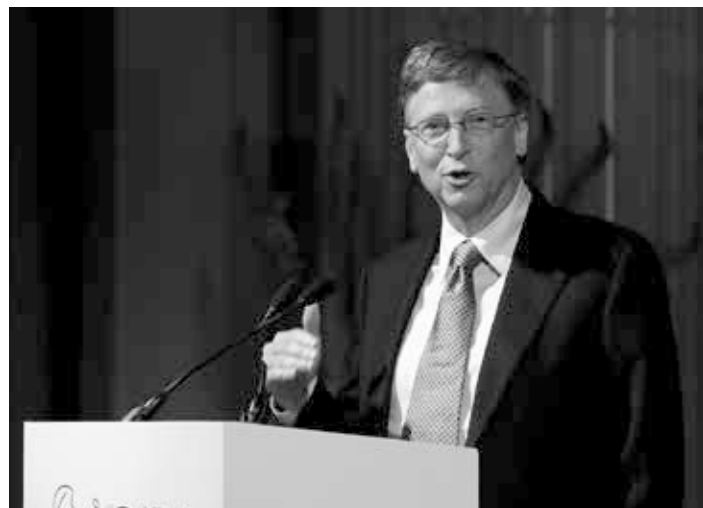
Foto: Grundlægger af Microsoft Bill Gates taler ved the GAVI Alliance immunisation event i England 13 Juni 2011.

tioner (igennem vacciner), i stedet for horisontale og holistiske tilgange (for eksempel at styrke sundhedssystemer)." Derudover