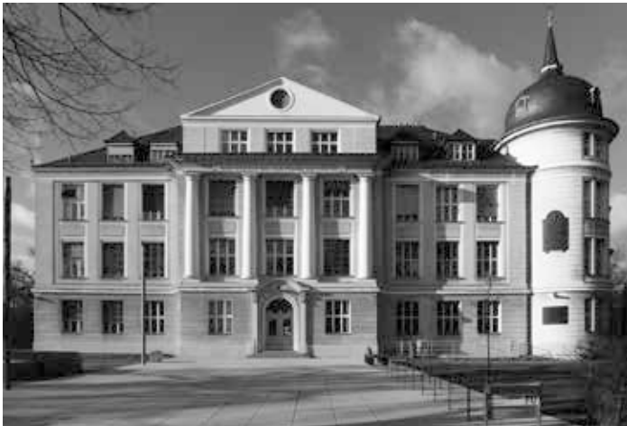
Tidligere Kaiser-Wilhelm-Institut for kemi i Berlin.