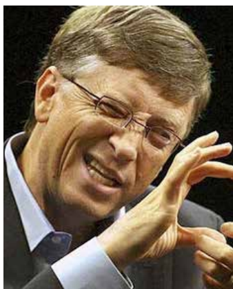
Foto: screenshot LinkedIn Understandably: "Bill Gates Says This 1 Intense Habit Separates Highly Successful People From Those Who Only Dream" < https://www.linkedin.com/pulse/bill-gates-says-1-intense-habit-separates-highly-from-bill-murphy-jr- >

der ligger meget langt fra hans offentlige udmeldinger.