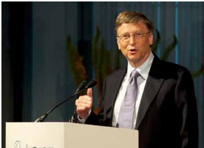
Foto: Grundlægger af Microsoft Bill Gates taler ved the GAVI Alliance immunisation event i England 13 Juni 2011.

tioner (igennem vacciner), i stedet for horisontale og holistiske tilgange (for eksempel at styrke sundhedssystemer)." Derudover