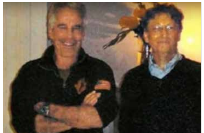
Foto: screenshot YouTube: DelCarajoTV: "La Historia oculta de Bill Gates que nadie se atreve a contar: Es amigo de Jeffrey Epstein... 14.06.2020" < https://www.youtube.com/watch?v=c3vB0Dhet2E >

Hvis vi skal dømme et individ på deres omgangskreds, de projekter, som de finansierer, og på de ord, som de udtaler[45], så står det klart, at i Gates-familiens historie har de støttet op om og promoveret eugenik. Klædt på med denne viden kan vi kaste et nyt blik på Bill Gates' filantropi og blive bevidst om, at han muligvis har motiver,