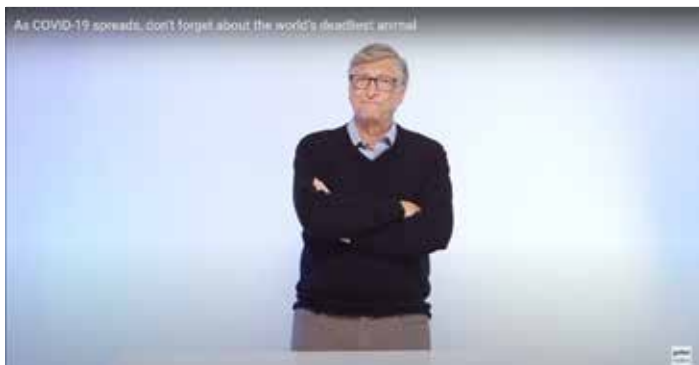
Gates Notes: „As COVID-19 spreads, don't forget about the world's deadliest animal“ 17.08.2020. < https://www.youtube.com/watch?v=UOHHAz2nBE >

Ekspert i sundhed har utallige gange rejst tvivl om de videnskabelige antagelser bag nedlukningerne. Som det seneste nye har Michael Levitt, en professor fra Stanford University, der forudsagde pandemiens første forløb, udtalt[4], at han mente, at nedlukningerne var en ”stor fejltagelse[5]”, som faktisk kan have kostet liv.