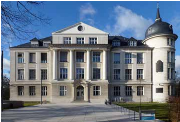
Tidligere Kaiser-Wilhelm-Institut for kemi i Berlin.