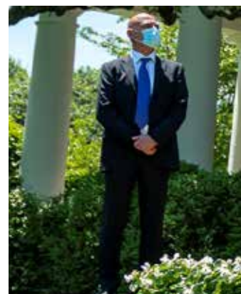
Foto: Moncef Slaoui lytter mens Gustave Perna, kommanderende general i U.S. Army Material Command, kommer med bemærkninger under en update om vaccine udviklingen. 15 maj, 2020, i the Rose Garden of the White House. (Official White House Photo by Shealah Craighead). Wikimedia Commons. Public Domain.

Som The Last American Vagabond rapporterede[15], har Donald Trump også udpeget dr. Moncef Slaoui – en tidligere "Big Pharma"-chef, der indtil for nylig sad i bestyrelsen i Moderna – til den "vaccine-tzar", der skal lede "Operation Warp Speed," - hvilket er Trump-administrationens indsats for hurtigt at udvikle en vaccine inden slutningen af 2020. I 2016 blev Slaoui udpeget til at sidde i Moderna Therapeutics' bestyrelse[16]. Han trådte tilbage, efter han blev udpeget til en position i den nuværende amerikanske regering.