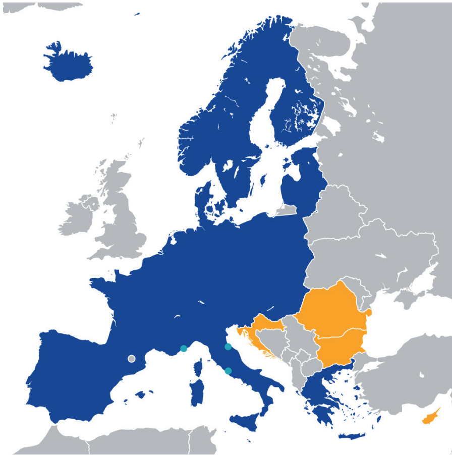
(blau: Schengengebiet, hellblau: Länder mit offenen grenzen, gelb: werden künftig Teil des Schengengebiets (Karte: Rob984 / Wikimedia Commons / CC BY-SA 4.0)

jährlichen Schweizer Beitrags von jetzt knapp 24 Millionen bis im Jahre 2027 auf 61 Millionen Franken. Für die bürgerlichen Parteien FDP und Mitte geht es um die Garantie der Schengen-Mitgliedschaft und – nach dem Abbruch der Verhandlungen über ein Rahmenabkommen – um die Abwendung eines europapolitischen Totalschadens. Die chronischen EU-Skeptiker der SVP sind mehrheitlich für Frontex, weil sie Migrantinnen und Migranten den Zugang in den Schengen-Raum erschwert, eine Minderheit hingegen sagt nein, weil sie keine gemeinsame Sache mit der EU machen will.