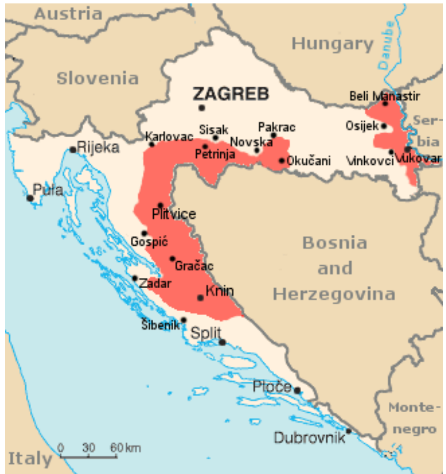
Die Serbische autonome Republik Krajina wurde als Reaktion auf die Staatsgründung Kroatiens als Staat der Kroaten gegründet. (Karte: Nikola Smolenski / Wikimedia Commons / CC BY-SA 3.0)

Dieses Vorgehen entsprach der politischen und gesellschaftlichen Ausrichtung des neuen Staates. Bereits 1990, am Beginn der Schwächephase des jugoslawischen Bundesstaates, hatten dort ultrana-