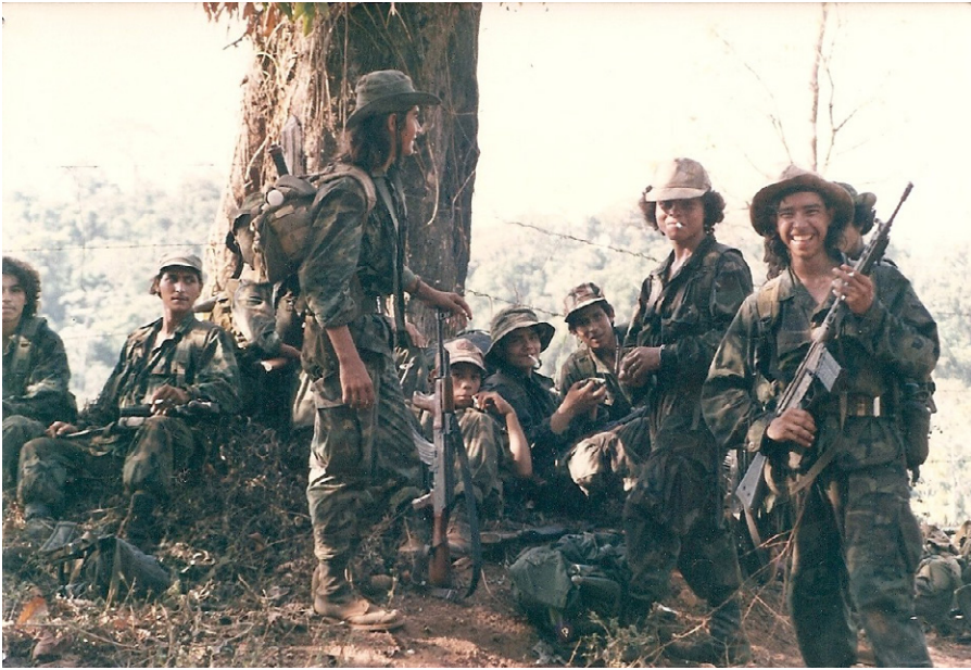
Die Kommandos der Frente Sur machen eine Rauchpause, nachdem sie den FSLN-Stützpunkt in El Serrano gestürmt haben. Südosten Nicaraguas 1987.

als Gouverneur vielen anderen Bundesstaaten an, indem er ein Kontingent der Nationalgarde von Arkansas nach Honduras schickte, um die nicaraguanischen Contras darin auszubilden, wie sie die sandinistische Regierung stürzen könnten [4]. Clinton besprach seine Kenntnisse über diese Operation aus erster Hand auch mit dem heutigen Generalstaatsanwalt der Trump-Regierung, William Barr.