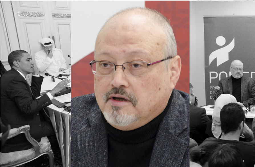
links: Khashoggi mit Obama in Kairo 2009 – mittig: Portrait aus 2018 – rechts: Öffentliche Diskussionsrunde im März 2018 in Washington D.C.

„Laut einem US-Ermittler mit umfangreichem Wissen über die Aktivitäten von BCCI haben einige BCCI-Beamte zugegeben, dass mehrere der Frauen, die manchen Mitgliedern der Al-Nahyan-Familie [eine der herrschenden Familien in den VAE] zur Verfügung gestellt wurden, junge Mädchen waren, die noch nicht die Pubertät erreicht hatten und in bestimmten Fällen durch die Erfahrung körperlich verletzt wurden. Der Beamte sagte, dass ehemalige BCCI-Beamte ihm erzählt hätten, dass BCCI auch Männer an homosexuelle VIPs vermittelt habe.“