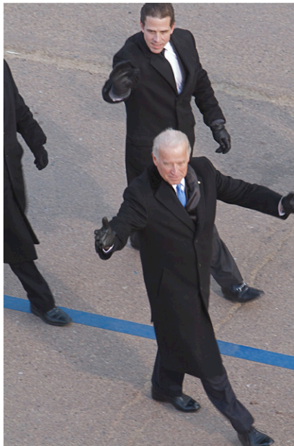
Der damalige Vize- und jetzige Präsident Joe Biden und sein Sohn Hunter Biden.

Die Einwände dagegen, dies alles heute zur Kenntnis zu nehmen, sind auf trostlose Weise vorhersehbar. Die Berichterstattung über Hunter Biden ist irrelevant, da er selbst kein Kandidat war (was aber die Meldungen so relevant machte, war das, was sie über die Beteiligung von Joe Biden an diesen Geschäften enthüllte). In Anbetracht des Krieges in der Ukraine ist jetzt nicht der richtige Zeitpunkt, um über all dies zu diskutieren (auch wenn sie in der Regel ignoriert werden, so werden im-