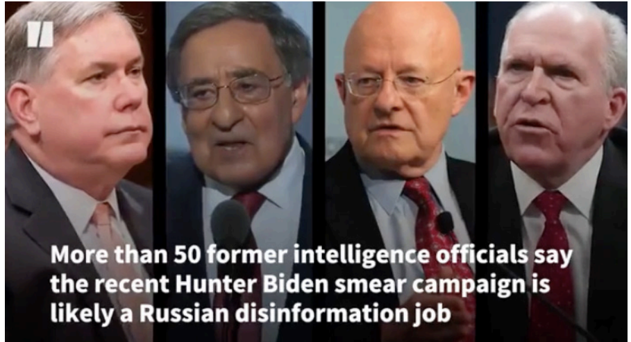
„Huffington Post’s false Biden campaign ad masquerading as a „report“ Youtube, Glenn Greenwald, Video: https://youtu.be/3GCKBYx17c [12]

Diese Desinformationskampagne über die Biden-E-Mails wurde dann von Big Tech