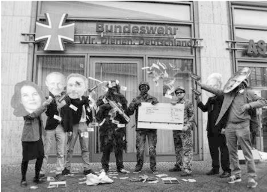
Aktion gegen das 100 Milliarden schwere Sondervermögen zur Aufrüstung.

meint, länger als eine Legislaturperiode zusammenarbeiten zu können und eine kontinuierliche Aufrüstung in den Verfassungsrang heben will. Dadurch möchte sie gewährleisten, dass zukünftige, anders zusammengesetzte Koalitionen das Megarüstungsprogramm weder stoppen, kürzen oder verändern können, weil es in Verfassungsstein gemeißelt ist.