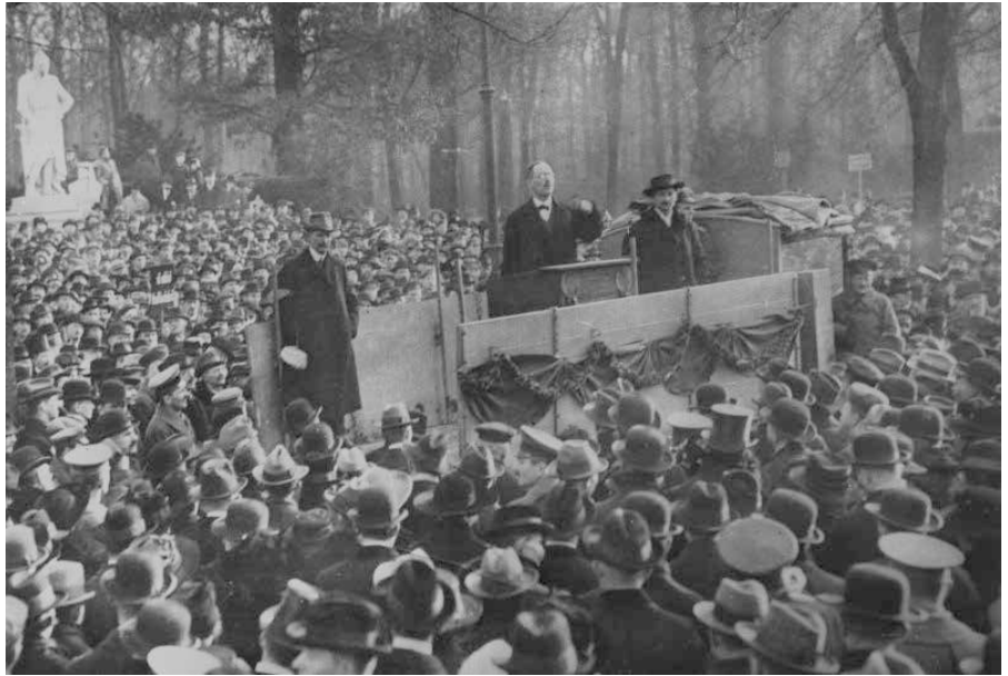
Karl Liebknecht bei einer Rede im Tiergarten 1918. Er ist der einzige Abgeordnete der gegen die Kriegskredite 1914 stimmt.

3. Der Verteidigungsetat wird künftig das Zwei-Prozent-Ziel der Nato übererfüllen und es sollen sogar „mehr als zwei Prozent“ des Bruttoinlandsprodukts (BIP) in die Verteidigung investiert werden. Bislang galten schon 1,5 Prozent als ambitioniert. Bei einer Wirtschaftsleistung von 3,57 Billionen Euro sind das über