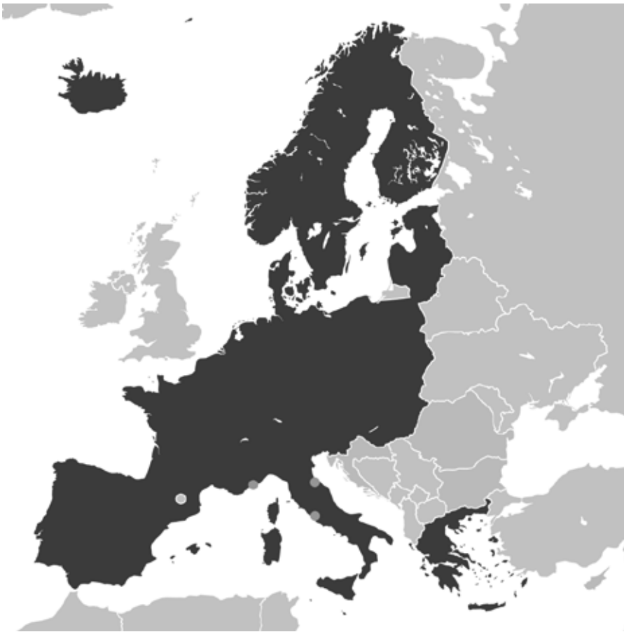
(blau: Schengengebiet, hellblau: Länder mit offenen grenzen, gelb: werden künftig Teil des Schengengebiets (Karte: Rob984 / Wikimedia Commons / CC BY-SA 4.0)

jährlichen Schweizer Beitrags von jetzt knapp 24 Millionen bis im Jahre 2027 auf 61 Millionen Franken. Für die bürgerlichen Parteien FDP und Mitte geht es um die Garantie der Schengen-Mitgliedschaft und – nach dem Abbruch der Verhandlungen über ein Rahmenabkommen – um die Abwendung eines europapolitischen Totalschadens. Die chronischen EU-Skeptiker der SVP sind mehrheitlich für Frontex, weil sie Migrantinnen und Migranten den Zugang in den Schengen-Raum erschwert, eine Minderheit hingegen sagt nein, weil sie keine gemeinsame Sache mit der EU machen will.