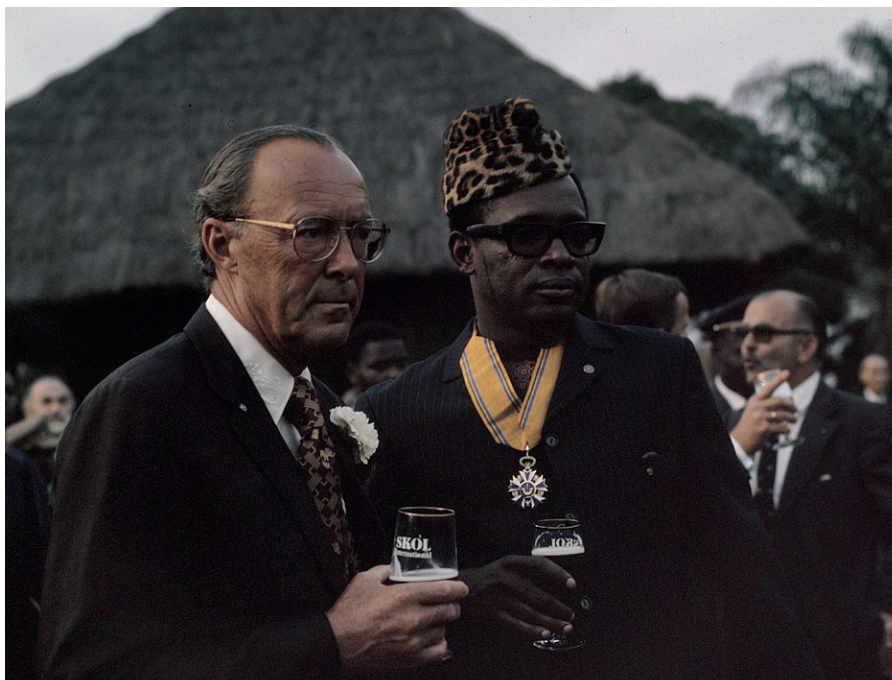
Prinz Bernhard mit Präsident Mobutu in Zaire am 12.8.1973

https://data.worldbank.org/indicator/SP.DYN.IMRT.IN?locations=US