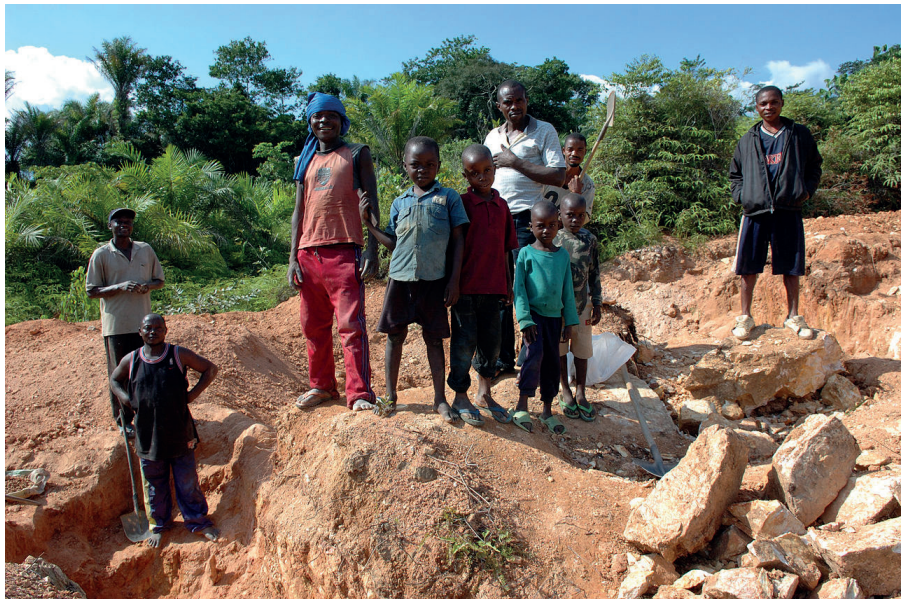
Kinderarbeit im Bergbau: zusammen mit ihren Eltern arbeiten Kinder in Kailo, Kongo am 31.10.2007

Kabila zerstritt sich bald mit seinen ugandischen und ruandischen Unterstützern. Mit deren Hilfe wurde 1998 eine neue Partei gegründet: die Versammlung für kongolesische Demokratie (Rassemblement Congolais pour la Démocratie, RCD). Diese gegen Kabila gerichtete RCD spaltete sich in militante Rebellengruppen auf und rückte im ganzen Land vor. Truppen aus Angola, dem Tschad, Libyen und Simbabwe marschierten in die DR Kongo ein, um Kabila zu unterstützen. 2001 wurde Kabila ermordet, sein 1971 geborener Sohn Joseph regierte das Land von 2003 bis 2019.