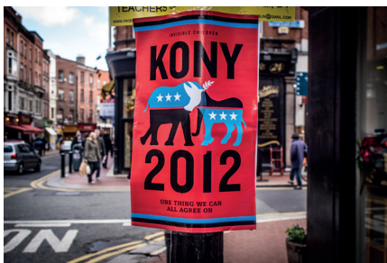
Plakat zur Kampagne KONY 2012 von Invisible Children Inc. in den Straßen Dublins, Irland am 1.4.2012

Das Drängen der Bush-Regierung, die FARDC zu „professionalisieren“ und zu „legitimieren“, fiel mit den wachsenden Aktivitäten Chinas im Lande zusammen. In einem Dokument des Fort Benning Training and Doctrine Command wird die Tatsache beklagt: