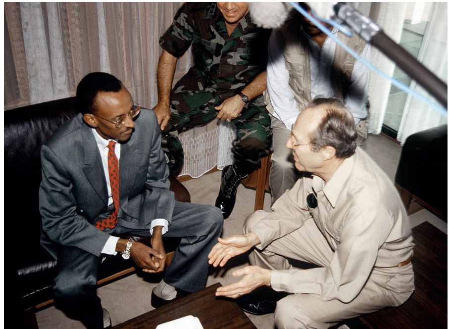
Verteidigungsminister William Perry und der ruandische Vizepräsident Paul Kagame diskutieren über die Lage in Ruanda am 31.7.1994

„Kabilas Verstaatlichungen senden ein besorgniserregendes Signal ... an ausländische Unternehmen, die in diesem an Bodenschätzen reichen Land gern Geschäfte machen würden“ [26].