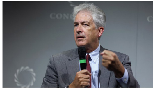
William Burns

The head of America's Central Intelligence Agency, William Burns, met Ukrainian President Volodymyr Zelensky and representatives of Kiev's intelligence services last week, CNN reported on Monday.