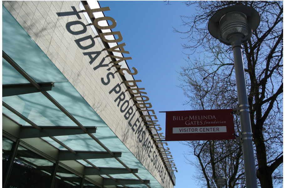
Bill & Melinda Gates Foundation - Fassade des Besucherzentrums

Website der Organisation enthalten (Anm. d. Redaktion: Die Links zur Organisation sind in den Quellenangaben zu finden).