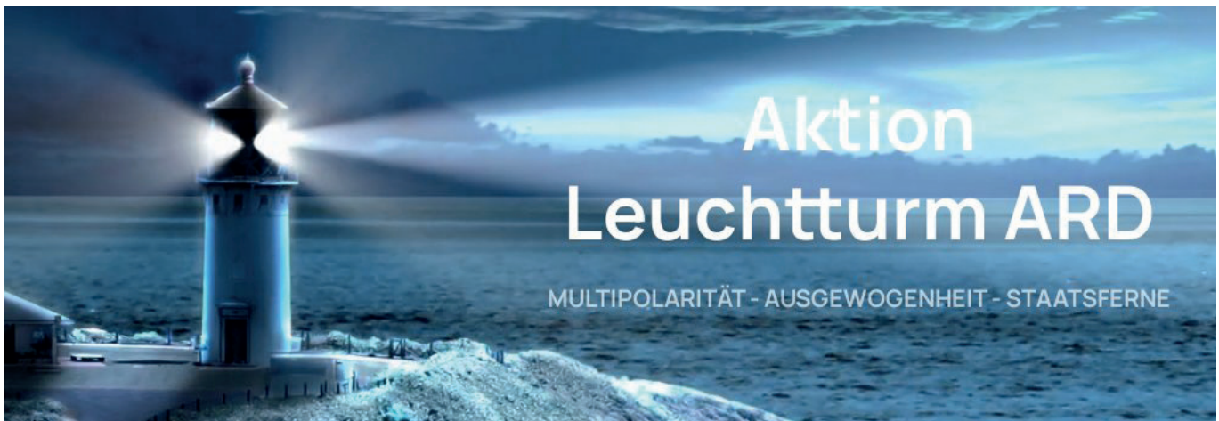
Das Aktionsbündnis Leuchtturm ARD tritt für eine Reform des öffentlich rechtlichen Rundfunks ein.