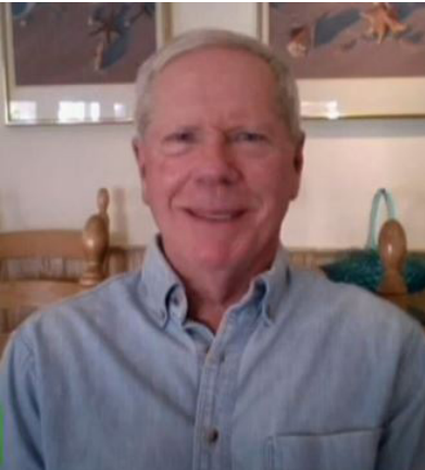
Paul Craig Roberts

hatten die Verbrechen und Untaten der US-Regierung den Ruf Washingtons bereits ausgehöhlt.