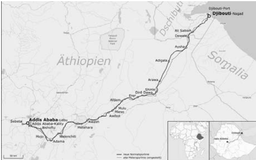
Bahnstrecke Addis Abeba-Dschibuti

die dringende Notwendigkeit erkannt, zusammenzuarbeiten und unsere Kräfte für einen sicheren Übergang im Land zu bündeln“, sagte ein Sprecher den versammelten Reportern [36]. Dass das Ereignis in Washington stattfand, hatte eine Symbolkraft, die man kaum übersehen konnte.