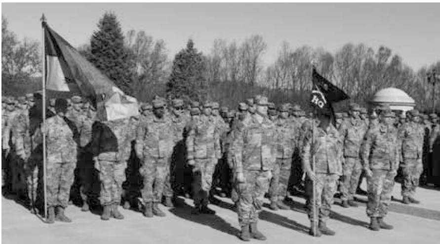
Mehr als 1.000 Soldaten der Nationalgarde der Armee von Virginia und Kentucky wurden an das Horn von Afrika entsandt.

Architektinnen der Intervention in Libyen, liegen „alle Optionen auf dem Tisch“ [7] – ein Ausdruck, der schon seit langem als Kriegsdrohung verstanden wird [8]. Auch Außenminister Antony Blinken wollte auf direkte Nachfrage die Entsendung von Truppen nach Äthiopien nicht ausschließen [9].