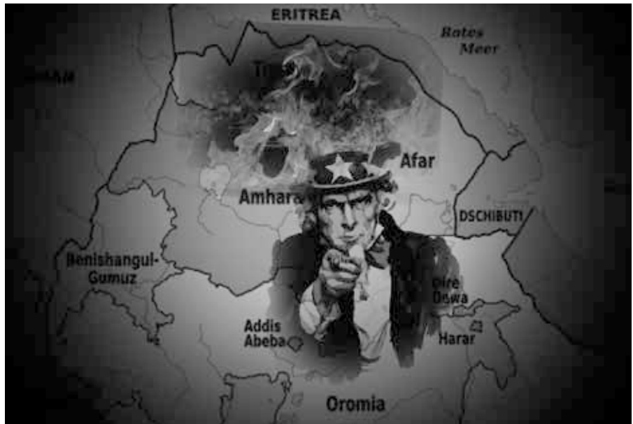
Äthiopien im Focus des US-Militärs? (Collage, Wikimedia Commons, Pixabay License)