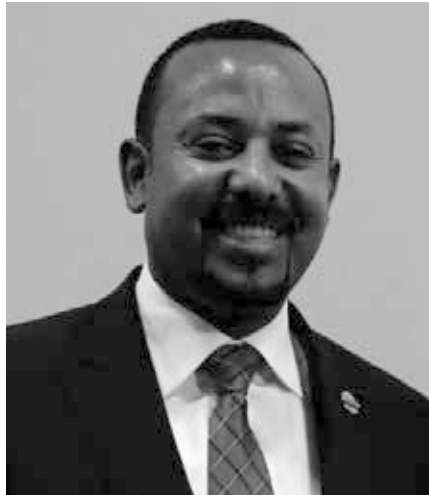
Äthiopiens Präsident Abi Ahmed

Daher ist dieser Konflikt letztendlich der Kampf zweier politischer Kräfte um die Kontrolle über die Wirtschaft Äthiopiens. Die Konzernmedien stellen die Sachlage jedoch überhaupt nicht so dar, sondern deuten sie als Auslöschung einer ethnischen Minderheit durch die Regierungen