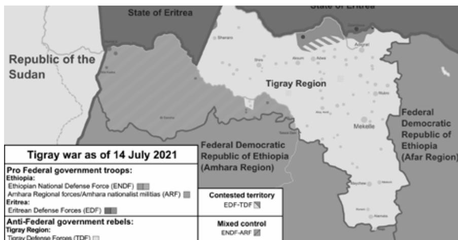
Die Tigray-Kriegskarte Stand Juli 2021 zeigt die ENDF-Streitkräfte, TPLF-Streitkräfte, unabhängige Amhara-Streitkräfte (mit Äthiopien verbündet) und Eritrea.

Seit Abiy Ahmed, der neue Premierminister, 2018 an die Macht kam, hat er eine Reihe von Änderungen gegen die TPLF eingeleitet. Unterstützer sehen diese als dringend benötigte Reformen an, um die Korruption und den Griff nach der Vormacht der TPLF im öffentlichen Leben zu verringern. Gegner sehen darin jedoch eine Überschreitung seiner Machtbefugnisse und die Verfolgung einer ethnischen Minderheit.