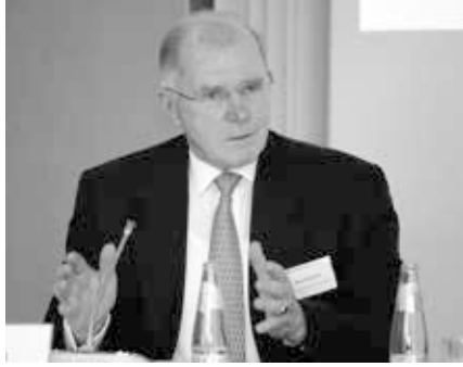
Klaus Naumann (ehem. Generalinspekteur der Bundeswehr) während einer Pressekonferenz in Berlin am 17. Juni 2011