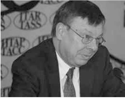
Ulrich Brandenburg (Deutscher Botschafter in Russland) während einer Pressekonferenz in Moskau am 14. September 2010