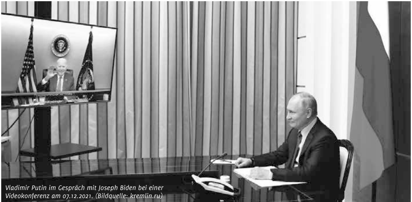
Vladimir Putin im Gespräch mit Joseph Biden bei einer Videokonferenz am 07.12.2021.