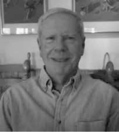
Paul Craig Roberts

hatten die Verbrechen und Untaten der US-Regierung den Ruf Washingtons bereits ausgehöhlt.