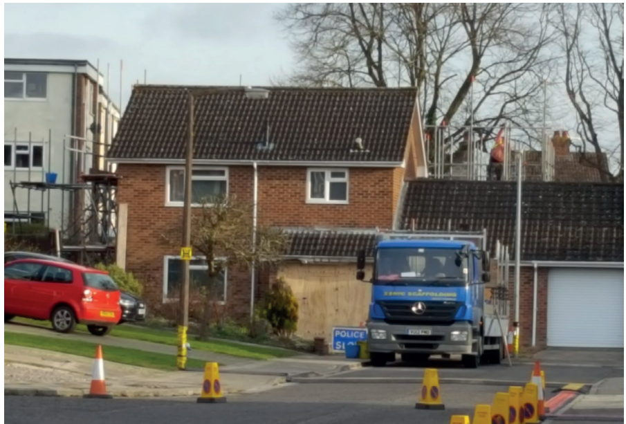
Ein Blick auf das Haus, das zuvor von Sergei Skripal bewohnt wurde und in dem er und seine Tochter angeblich durch ein Nervengas kontaminiert wurden, das am Türgriff der Haustür zurückgelassen wurde.