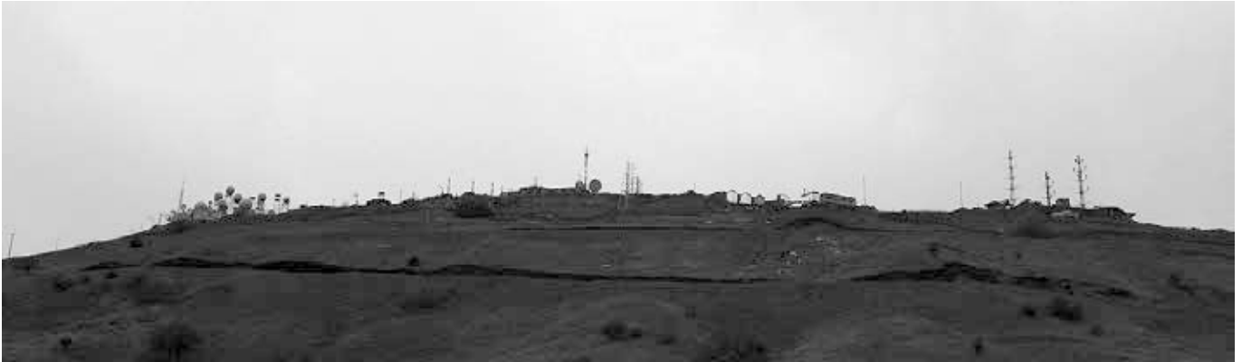
Standort der Unit 8200 auf dem Mount Avital, Golanhöhen