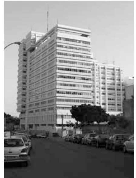
Hadar-Dafna-Gebäude, Zentrale des Mossad in Tel Aviv

In Anbetracht der Tatsache, dass das Netzwerk des organisierten Verbrechens, das mit der Mega Group verbunden war, Verbindungen sowohl zum US-amerikanischen als auch zum israelischen Geheimdienst hatte, könnte sich das Codewort „Mega“ plausibel auf diese geheimnisvolle Gruppe von Milliardären bezogen haben. Weitere Belege für diese Theorie liefert die Tatsache, dass prominente Mitglieder der Mega Group Geschäftspartner von Mossad-Agenten waren, darunter der Medienmogul Robert Maxwell und der Rohstoffhändler Marc Rich.