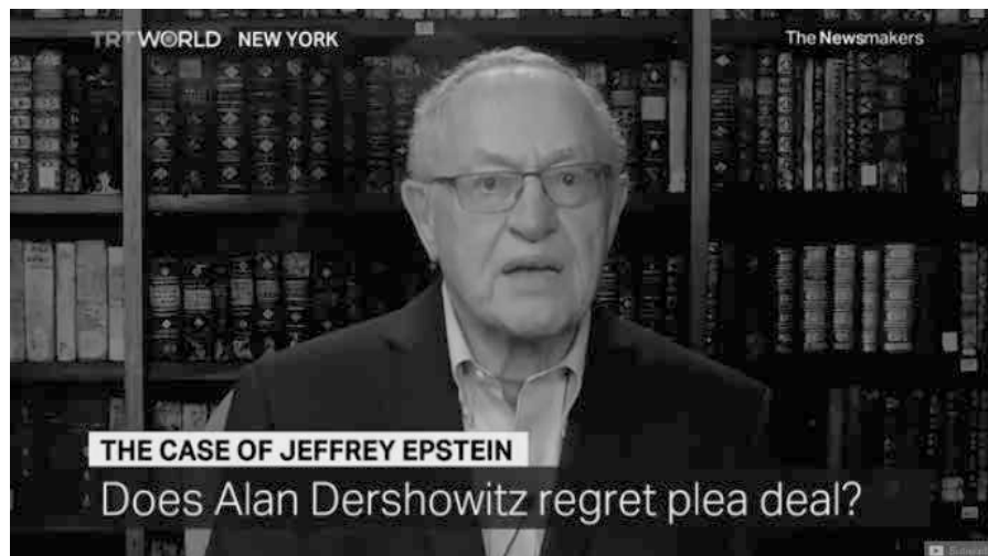
Alan Dershowitz, Anwalt von Epstein im Jahr 2008, Interview auf TRT World „Is Alan Dershowitz Part of the Epstein Scandal?“ 19.7.2019

dass der einzige Weg, einen österreichischen Pass zu erwerben, darin bestand, ihn auf unkonventionelle Weise zu erlangen – d.h. mit Hilfe eines gut vernetzten österreichischen Offiziellen oder ausländischen Diplomaten mit Einfluss in Österreich.