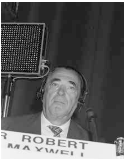
Robert Maxwell 1989

Vor allem die Verbrecherfamilie Genovese ist seit langem ein wichtiger Bestandteil des National Crime Syndicates,