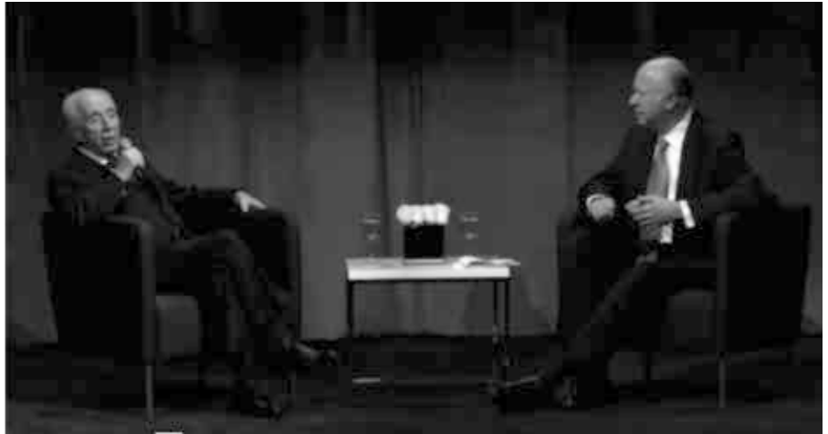
„A Conversation between Shimon Peres and David Gergen“, (Video publiziert auf wexnerfoundation.org , VIMEO)