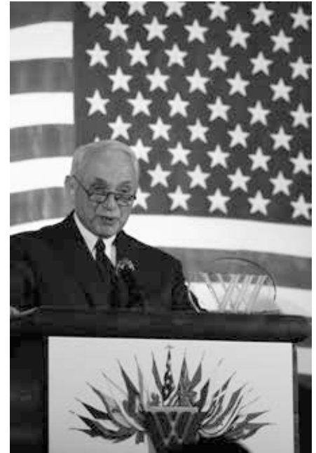
Leslie Wexner (2004)

Den weiteren Vormarsch der Familie Bronfman auf dem „Weg zur Seriosität“ übernahmen die Kinder von Bronfman, die in aristokratische Familien wie die europäischen Rothschilds [44] und die