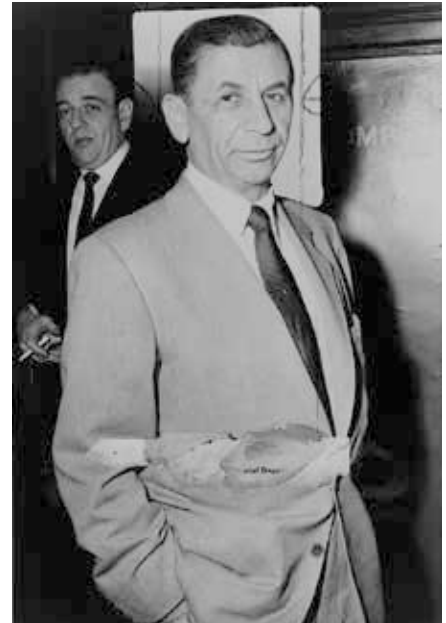
Meyer Lansky

Obwohl die Mega Group offiziell erst seit 1991 existiert, wurde der Einsatz von „Philanthropie“ zur Vertuschung skrupelloser Lobbyarbeit oder Geschäfts-