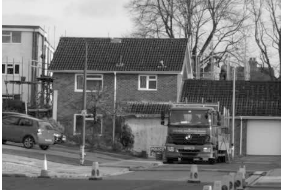
Ein Blick auf das Haus, das zuvor von Sergei Skripal bewohnt wurde und in dem er und seine Tochter angeblich durch ein Nervengas kontaminiert wurden, das am Türgriff der Haustür zurückgelassen wurde.