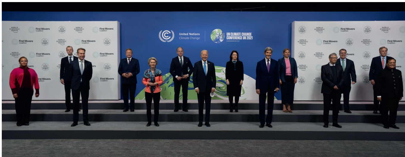
COP26 Klima Konferenz in Glasgow. Mit dabei Børge Brende, Präsident des WEF, US Präsident Joe Biden, Ursula von der Leyen und Bill Gates, von der Bill & Melinda Gates Foundation

ner im Gefängnis von Abu Ghraib deutlich gemacht, dass bei einer solchen Behandlung körperliche Gewalt und Demütigung in der Tat schwer zu trennen sind.