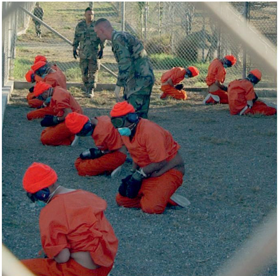
Psychologische Folter: „Nicht-konforme“ Gefangene in orangefarbenen Uniformen und Masken, die 2002 in Guantánamos Camp X-Ray festgehalten wurden.