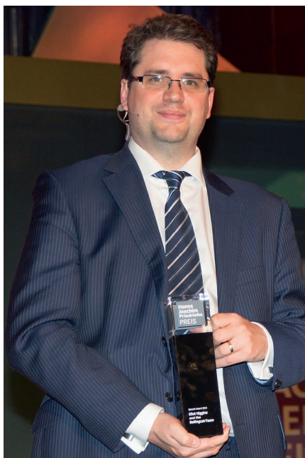
Verleihung des Hanns-Joachim-Friedrichs-Preises 2015 in Köln: Eliot Higgins.

Higgins Unterstützung des führenden Twitter-Propagandisten von ISIS in jüngerer Zeit wirft weitere ernsthafte Fragen über Bellingcats Vertrauen in salafistisch-dschihadistische Elemente in Syrien auf [7].