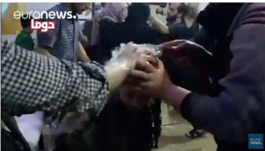
Video angeblicher Giftgasopfer in Duma. (Youtube, https://youtu.be/1BhiS9Sil4A )