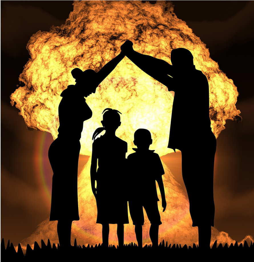
Wollen die USA bis zum Letzten gehen und einen Atomkrieg riskieren? Die Gefahr besteht, wenn die USA die Ukraine in die NATO holen und ihre Raketen dort aufstellen

Mit dem Ende des Kalten Krieges hat sich im Westen das Gefühl durchgesetzt, man könne die Welt dominieren und der ganzen Welt das eigene System aufzwingen. Der von den USA dominierte Westen beansprucht dabei für sich zu allem Überfluss eine moralische Überlegenheit, aus der er für sich das Recht herleitet, zu entscheiden, welche Staaten eine akzeptable Regierungs- und Wirtschaftsordnung haben und welche sie im Interesse des Westens ändern müssen. Das steht im eklatanten Widerspruch zum Völkerrecht, was den Westen aber nicht stört.