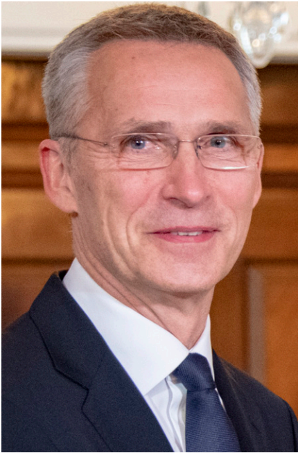
Generalsekretär der NATO Jens Stoltenberg

Generalsekretär Stoltenberg am 30. November [6]: