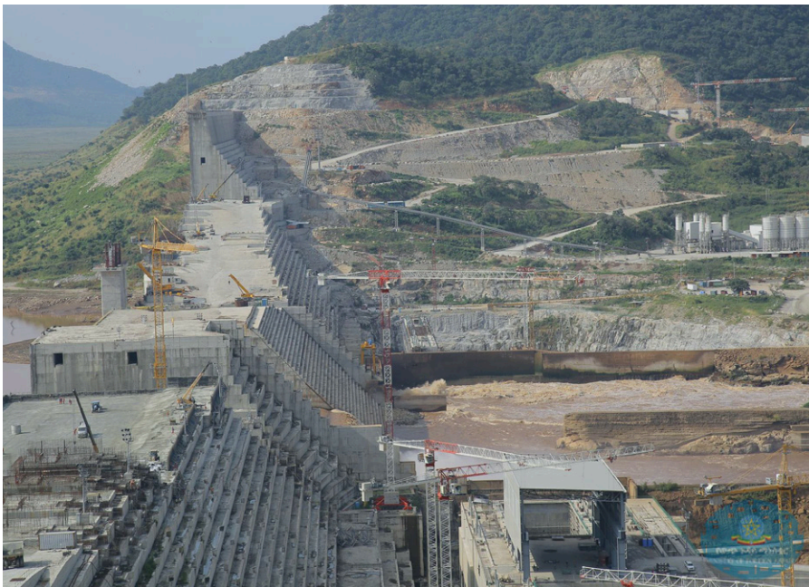
Der Grand Ethiopian Renaissance Dam (GERD) hat nicht nur das Potenzial Strom für Äthiopien zu erzeugen, sondern auch den Sudan und Ägypten von lebenswichtigem Wasser aus dem Nil abzuschneiden.

von Jeffrey Feltman herausgegeben wurde, als er als UN-Untergeneralsekretär tätig war. Das Dokument wurde 2018 vom russischen Außenminister Lawrow öffentlich gemacht [8].