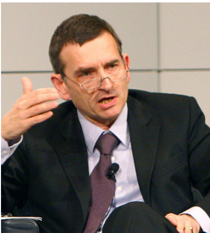
Volker Perthes ist ein deutscher Politikwissenschaftler (SWP- Stiftung wissenschaft und Politik) und seit Februar 2021 UN-Sonderbeauftragter für den Sudan. Er arbeitete mit Jeffrey Feltman an der Destabilisierung Syriens.

Feltman und Perthes arbeiteten, während des Arabischen Frühlings, bei schwarzen Operationen zur Zerstörung des Libanon und zur Destabilisierung von Bashar al-Assad in Syrien eng zusammen. Beide sollen auch eng mit der CIA zusammengearbeitet haben [1].