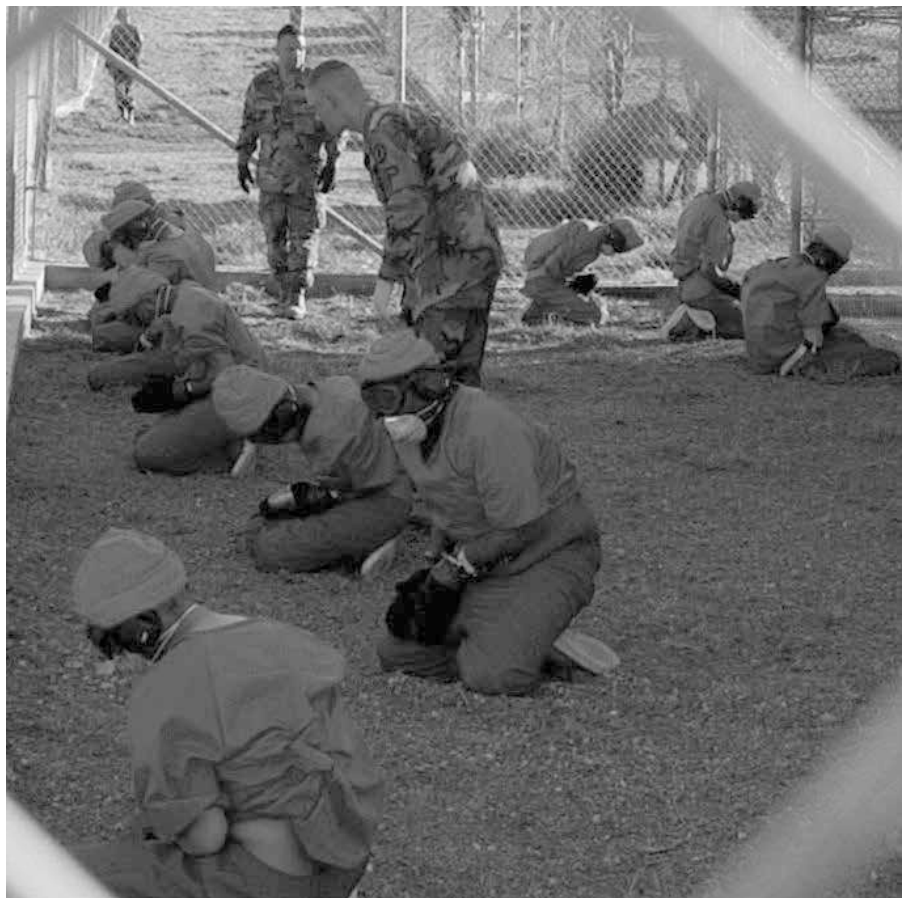
Psychologische Folter: „Nicht-konforme“ Gefangene in orangefarbenen Uniformen und Masken, die 2002 in Guantánamos Camp X-Ray festgehalten wurden.