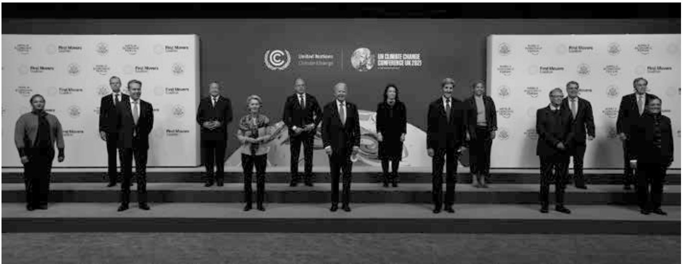
COP26 Klima Konferenz in Glasgow. Mit dabei Børge Brende, Präsident des WEF, US Präsident Joe Biden, Ursula von der Leyen und Bill Gates, von der Bill & Melinda Gates Foundation

ner im Gefängnis von Abu Ghraib deutlich gemacht, dass bei einer solchen Behandlung körperliche Gewalt und Demütigung in der Tat schwer zu trennen sind.