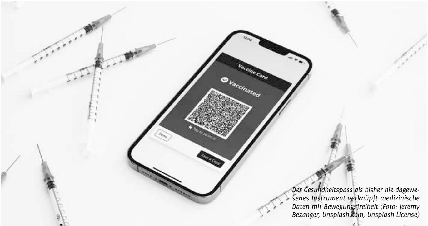
Der Gesundheitspass als bisher nie dagewesenes Instrument verknüpft medizinische Daten mit Bewegungsfreiheit