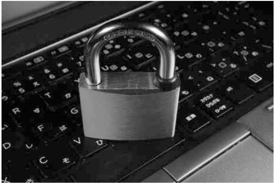
Es fehlt Transparenz zur Datensicherheit des Zertifikats und der Gesundheitsdaten

Ab September 2021 wurde der Gültigkeitsbereich des Covid-Zertifikats in den meisten Ländern sukzessive ausgeweitet. In der Schweiz beispielsweise haben seit dem 20. September 2021 nur noch Inhaber dieses QR-Codes Zugang zu Kultur-, Sport-, Gastronomie- und Indoor-Freizeitangeboten [3]. Aber auch an Hochschulen und in Krankenhäusern, sei es für besuchende oder einfach nur zur Arbeit gehende Personen, wie im Fall des Pflegepersonals bestimmter Einrichtungen oder bei Hochschuldozenten, findet er mittlerweile Verwendung. Die Tage des Antigentests als Möglichkeit, ein Covid-