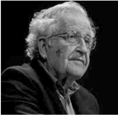
Noam Chomsky im Jahr 2015