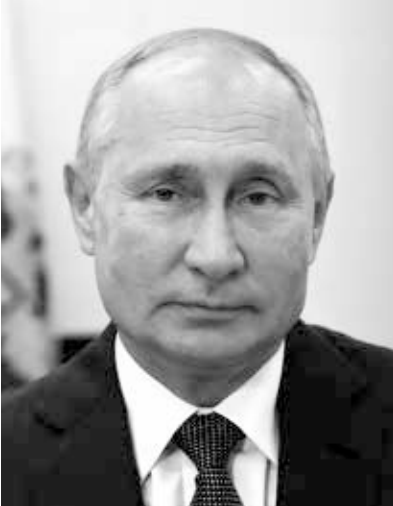
Wladimir Putin (2020)