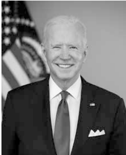
Joe Biden (2021)

Aber hier wittert Kiew eine Falle: Man vermutet dort, dass sie lügen und ist verzweifelt. Ihre wirtschaftliche Lage ist mehr als katastrophal. Das Wasser im Topf beginnt zu kochen. Vielleicht kommt es dann zu der Überzeugung – angesichts all dieser Schecks, die angeblich auf