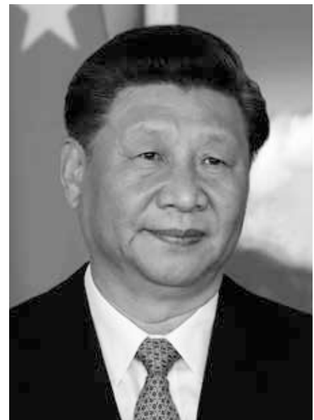
Xi Jinping (2019)

Vielleicht ist dies für das westliche Establishment kulturell zu schwer zu ertragen. Das ganze Bluffen mag der Ablenkung dienen. Die Gefahr besteht jedoch darin, dass einige US-Eliten ihren eigenen Bluffs Glauben schenken. Das Wasser im Topf erreicht den Siedepunkt. Vielleicht ist der Frosch schon zu zombifiziert, zu entnervt von der Hitze, um zu springen – und wenn er es versuchen sollte, könnte er feststellen, dass er nicht mehr die Energie und Vitalität hat, um die Brände unter ihm zu löschen – möglicherweise die Brände von Taiwan, Iran oder der Ukraine.