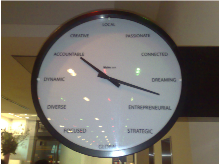
Hill © Knowlton Uhr.