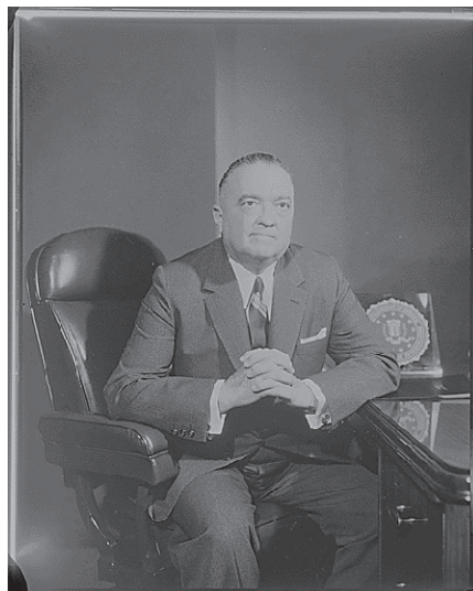
FBI Director J. Edgar Hoover.