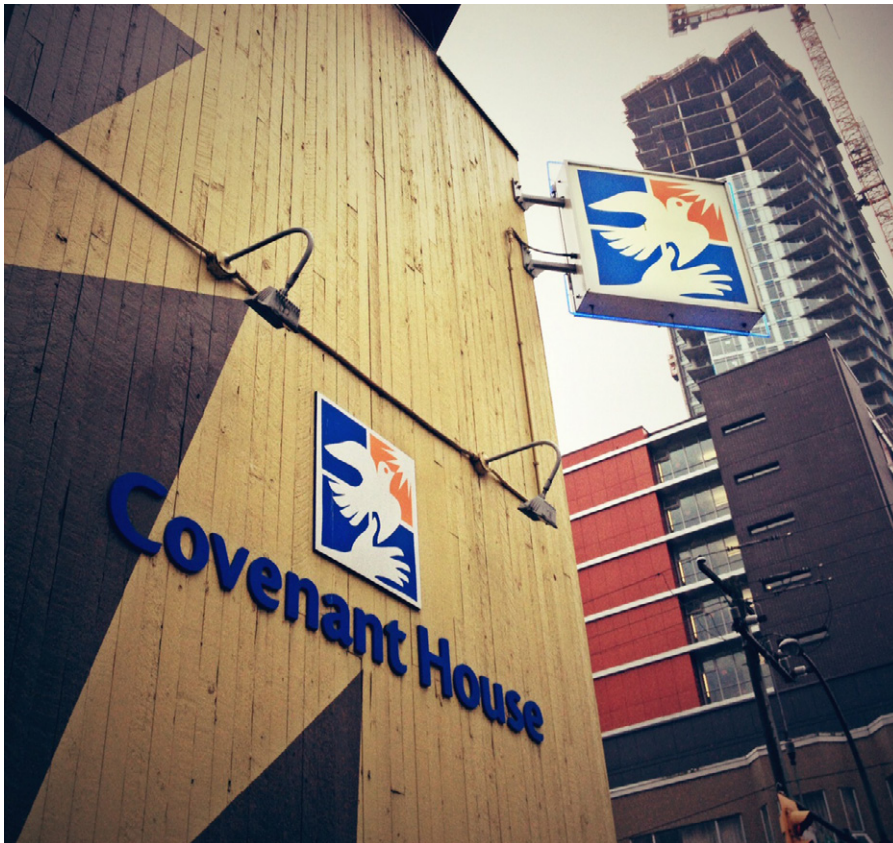
Covenant House ist eine grosse privat finanzierte Agentur in Nord- und Südamerika, die Obdachlosen und Ausreisern Unterkunft, Verpflegung, Soforthilfe und andere Dienstleistungen anbietet.