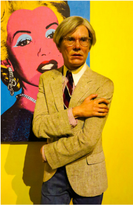
Madame Tussauds: Andy Warhol.