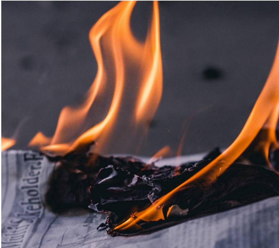
„Niemand wird jemals sehen, was ihr enthüllt“