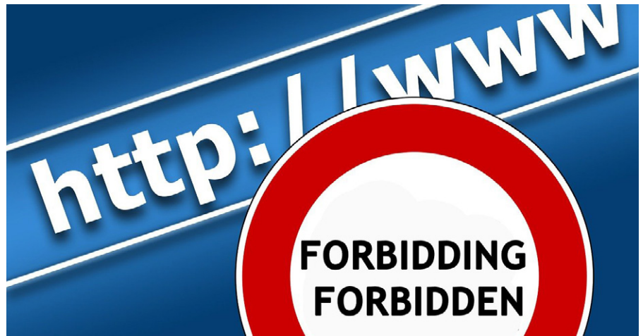
Kontrolle des Internet durch Algorithmen

„Eine weitere Überprüfung konzentrierte sich auf die Abteilung für öffentliche Angelegenheiten der kanadischen Streitkräfte und ihre Aktivitäten. Letztes Jahr hat die Abteilung einen umstrittenen Plan auf den Weg gebracht, der es den Offizieren für Öffentlichkeitsarbeit der