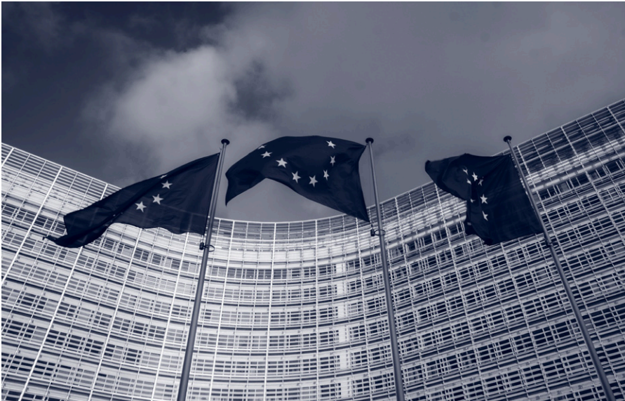
Flaggen der Europäischen Union vor dem Gebäude der EU-Kommission „Berlaymont“ in Brüssel, Belgien. Die EU-Kommission steht hinter der Zensuroffensive großer sozialer Medienplattformen.

en in großem Umfang. Wir haben also, zumindest was die Informationsfreiheit angeht, die pluralistische Gesellschaftsform hinter uns gelassen. Wir befinden uns stattdessen in einer zentral gelenkten Informationsgesellschaft, in der Institutionen mit totalitärem Anspruch bezüglich dessen, was wahr ist, und was wir glauben sollen, bestimmen, was wir zu lesen, zu sehen und zu hören bekommen.