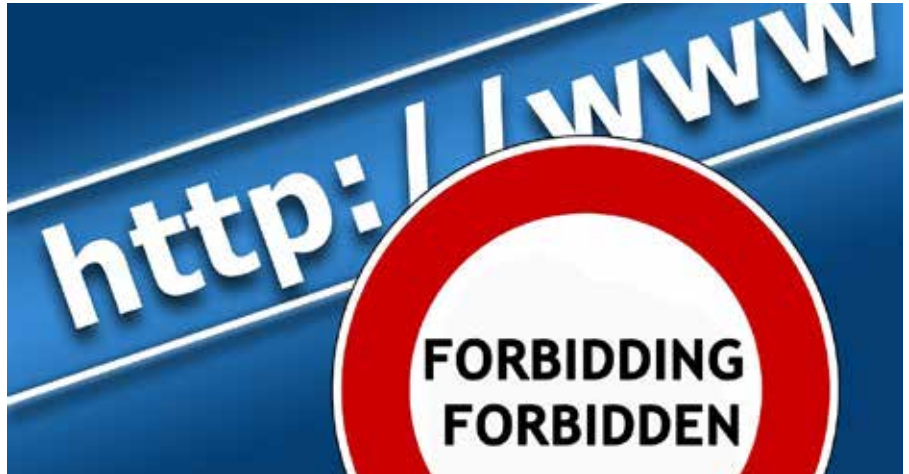
Kontrolle des Internet durch Algorithmen

„Eine weitere Überprüfung konzentrierte sich auf die Abteilung für öffentliche Angelegenheiten der kanadischen Streitkräfte und ihre Aktivitäten. Letztes Jahr hat die Abteilung einen umstrittenen Plan auf den Weg gebracht, der es den Offizieren für Öffentlichkeitsarbeit der