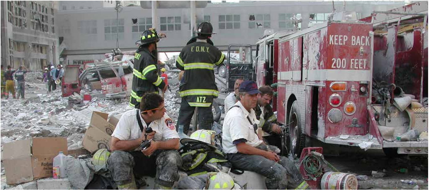
New Yorker Feuerwehrmänner nach den 9/11-Angriffen.