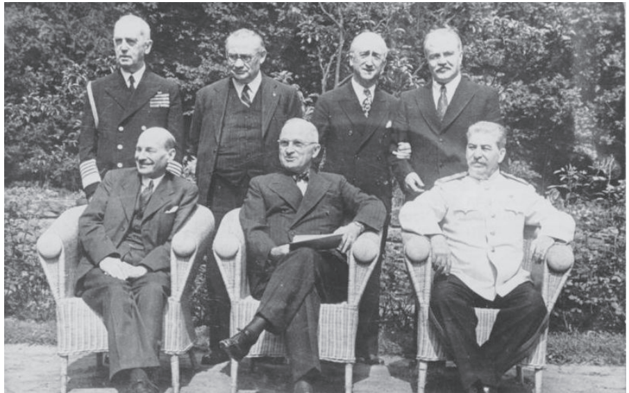
Gruppenbild der „großen Drei“ bei der Potsdamer Konferenz. Truman versuchte Stalin einzuschüchtern, indem er ihm ins Ohr flüsterte, Amerika habe eine unglaublich mächtige neue Waffe erworben. v.l.n.r.: sitzend: C.R. Attlee, H.S. Truman, Josef Stalin; stehend: Admiral J.D. Leahy, E. Bevin, J.W. Byrnes, und W.M. Molotow.

In gewisser Weise zog sich der Krieg mit Japan deshalb in die Länge, weil die UdSSR noch nicht in ihn verwickelt war. Aber Stalin hatte bereits 1943 versprochen, Japan innerhalb von drei Monaten nach der Kapitulation Deutschlands den Krieg zu erklären. Und er hatte diese Zusage noch am 17. Juli 1945 in Potsdam bekräftigt. Folglich baute Washington auf einen sowjetischen Angriff auf Japan