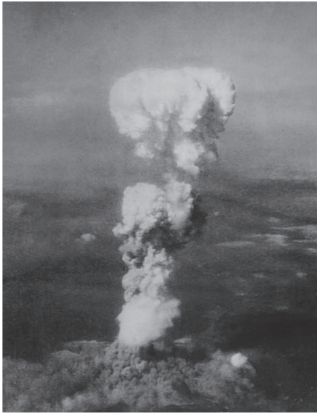
Atompilz über Hiroshima.

Und zweitens: Sicherheit vor möglichen zukünftigen Bedrohungen aus Deutschland. Diese Sicherheitsbedenken betrafen auch Osteuropa, insbesondere Polen, das ein potenzielles Sprungbrett für deutsche Aggressionen gegen die UdSSR war. Moskau wollte sicherstellen, dass in Deutschland, Polen und anderen osteuropäischen Ländern nie wieder ein der Sowjetunion feindlich gesinntes Regime an die Macht kommen würde. Die Sowjets erwarteten von den westlichen Verbündeten auch eine Bestätigung ihrer Rückgewinnung von Gebieten, die das revolutionäre Russland während der Revolution