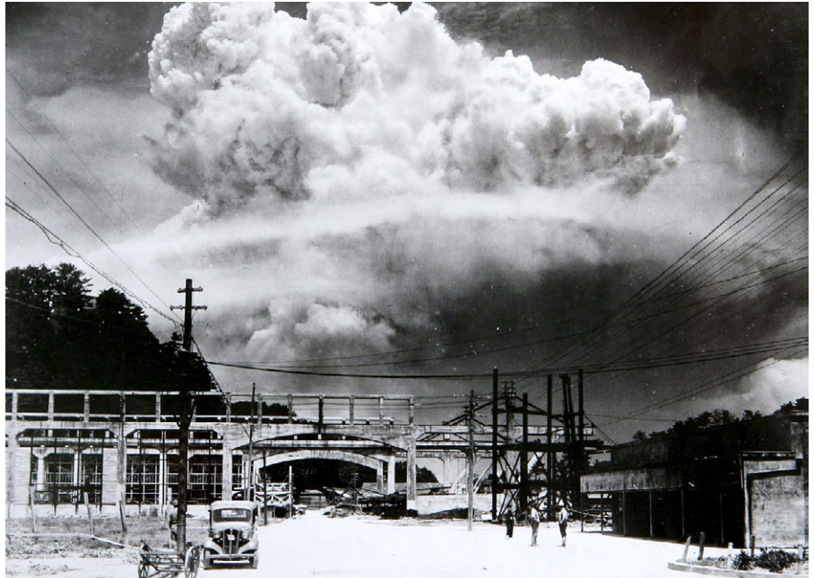
Atomexplosions-Pilzwolke über Nagasaki am 09.08.1945.