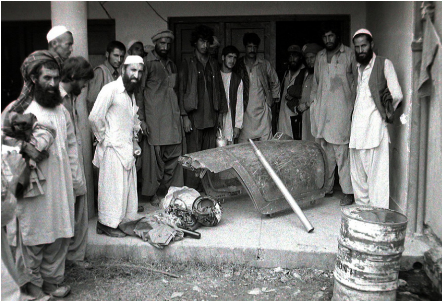
Die von den USA unterstützten Mudschaheddin zeigen Teile eines abgeschossenen sowjetischen Flugzeugs.