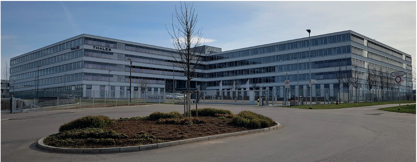
Die THALES Group ist ein französischer börsennotierter Rüstungskonzern mit Aktivitäten in Militärtechnik, Luft- und Raumfahrt sowie Sicherheit und Transport. Im Bild der Hauptsitz in Deutschland in Ditzingen