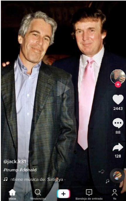
Jeffrey Epstein und Donald Trump.

fanden. Epstein schien eine Menge Material aus diesen Erpressungen in einem Safe auf seiner Privatinsel gesichert zu haben [5].