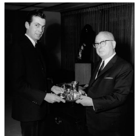
Edgar und Sam Bronfman.

Kurz nachdem die Prohibition in Kanada endete, begann sie in den Vereinigten Staaten. Als sich der Strom des illega-