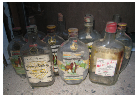
Alte Flaschen der Schenley Destillerie. Quelle: https://de.wikipedia.org/wiki/Schenley_Industries#/media/Datei:1940s_bourbon_whiskey_bottles.jpg , Foto: Wikipedia / Yourmanstan, Lizenz: CC BY 3.0

Hoovers eigene Neigung zur Erpressung lässt vermuten, dass er mit Rosenstiels sexueller Erpressungs-Operation noch direkter in Verbindung stand. Denn er wusste bereits, dass er kompromittiert war, und seine Beteiligung an der Operation würde somit als Mittel zur Beschaffung derjenigen Erpressungs-Materialien dienen, die er für seine eigenen Zwecke nutzen wollte. Wenn Hoover lediglich von der mit Lansky und Rosenstiel verbundenen Mafia erpresst worden wäre, wäre es in der Tat unwahrscheinlich, dass er so freundlich zu Rosenstiel, Lansky und den anderen Mafiosi bei diesen Treffen gewesen wäre und mit solcher Regelmäßigkeit daran teilgenommen hätte.