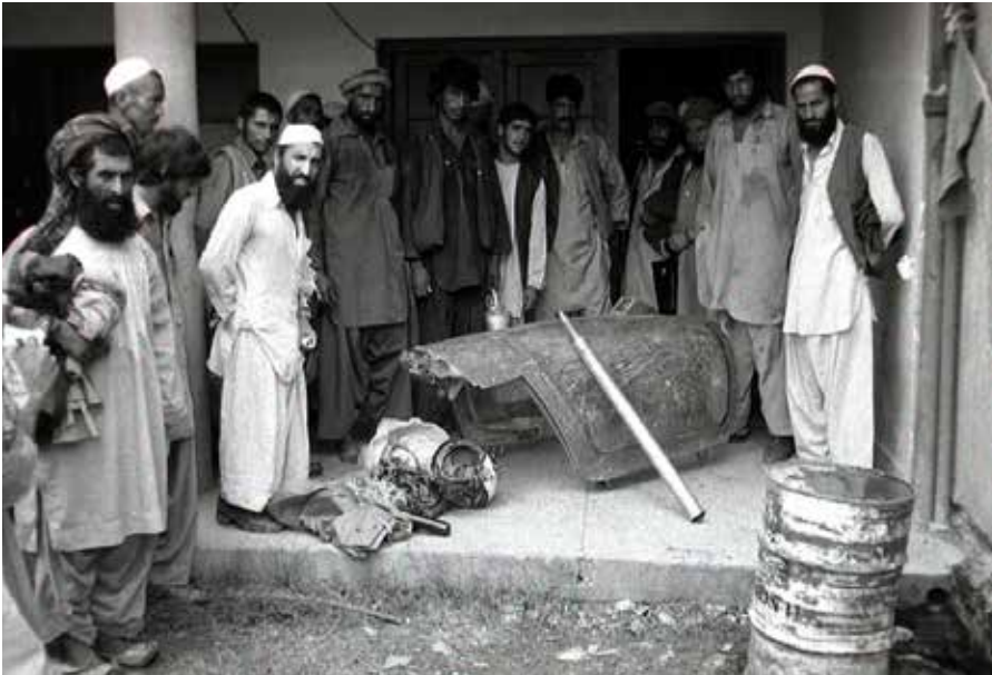
Die von den USA unterstützten Mudschaheddin zeigen Teile eines abgeschossenen sowjetischen Flugzeugs.