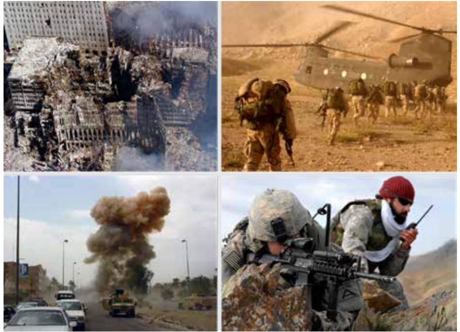
Collage aus Bildern des Krieges gegen den Terror: oben links: die Ruinen des World Trade Centers nach den Anschlägen vom 11. September 2001. Dies war der Kriegsgrund und Anfang des bis heute andauernden Krieges gegen den Terror; oben rechts: US-Soldaten mit einem Chinook-Transporthubschrauber in Afghanistan; unten links: eine Bombe explodiert nahe einem US-Konvoi bei Bagdad, unten rechts: US-Soldaten im Gefecht in Afghanistan.

wird? Denken Sie daran, dass die Statistiken über Tote, Verstümmelte und Flüchtlinge unter der sowjetischen Besatzung keine abstrakten Zahlen waren. Es waren lebende Frauen und ihre Söhne und Töchter, Ehemänner, Brüder und Schwestern, Mütter und Väter.