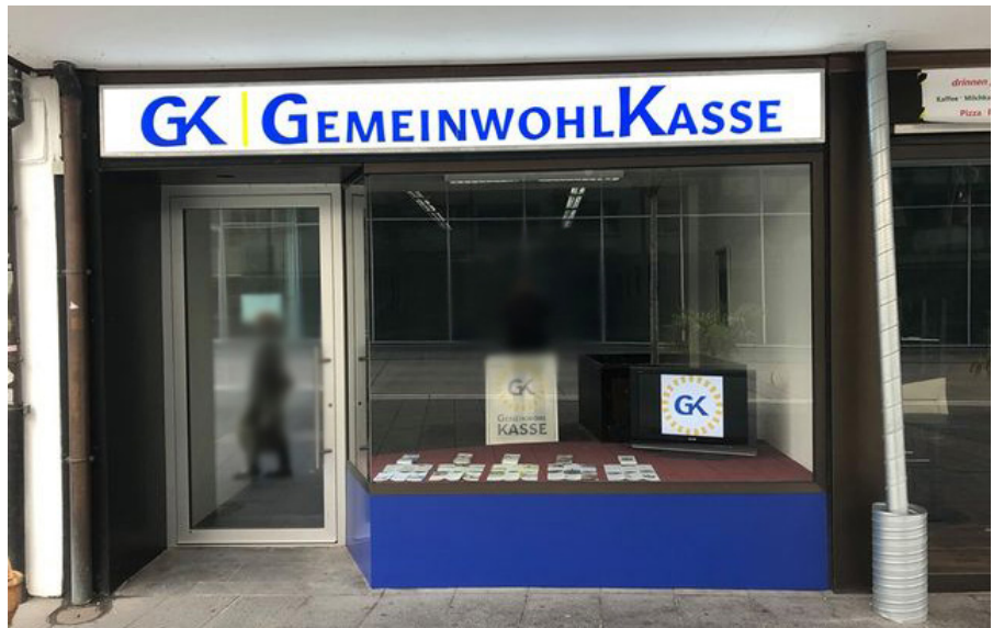
Die GemeinwohllKasse ist eine von Peter Fitzek bzw. dem Königreich Deutschland erfundene Neuerscheinung seiner bisherigen Königlichen Reichsbank.

Auf den Tischen lagen für die Querdenker diese drei Dokumente zum Ausfüllen aus: