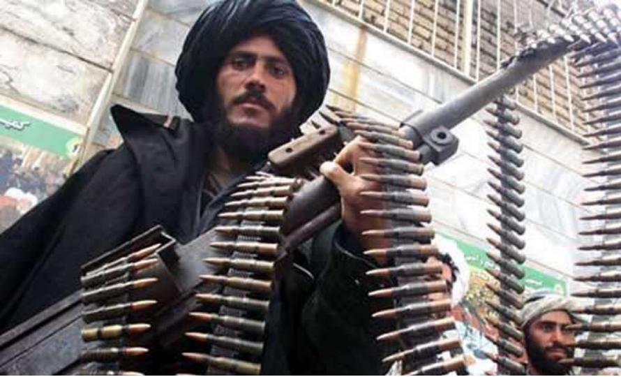
Taliban.

seinem historischen Adlerauge wiederbelebt – gleich zu Beginn der „Öffnung“ – durch Wirtschaftsreformen.