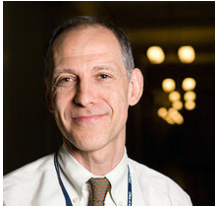
Der US-amerikanische Onkologe und Bioethiker Ezekiel Emmanuel entwarf Obamacare und hofft mit 75 zu sterben. Er setzt sich für eine Bevölkerungs-Kontrolle ein.

Ideologen, die sich für eine Weltregierung [14], die Eliminierung von Kranken und Alten (siehe Obamacare-Architekt