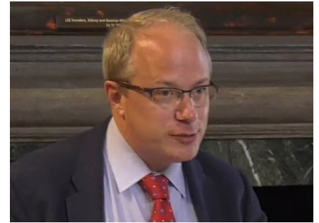
Adrien Vermeule schrieb zusammen mit Cass Sunstein das Buch „Conspiracy Theories“. In dem sie die größte Bedrohung für die herrschende Elite in Form von „Verschwörungstheorien“ darstellen.

Nur um das klarzustellen: Verschwörung bedeutet wörtlich „zwei oder mehr Personen, die gemeinsam in Übereinstimmung mit einer vereinbarten Idee und Absicht handeln“. Die Tatsache, dass Vermeule seine juristische Karriere auf der Argumentation aufbaute, die Gesetze nicht