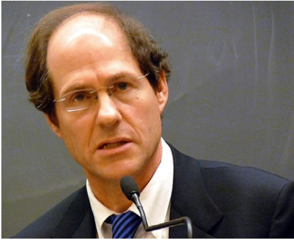
Cass Sunstein hat Jahrzehnte damit verbracht, menschliches Verhalten mit Computersimulationen zu modellieren, um es „wissenschaftlich zu steuern“.