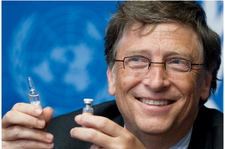
Bill Gates, Co-Vorsitzender der Bill & Melinda Gates Foundation, zeigt während der Pressekonferenz einen Impfstoff.