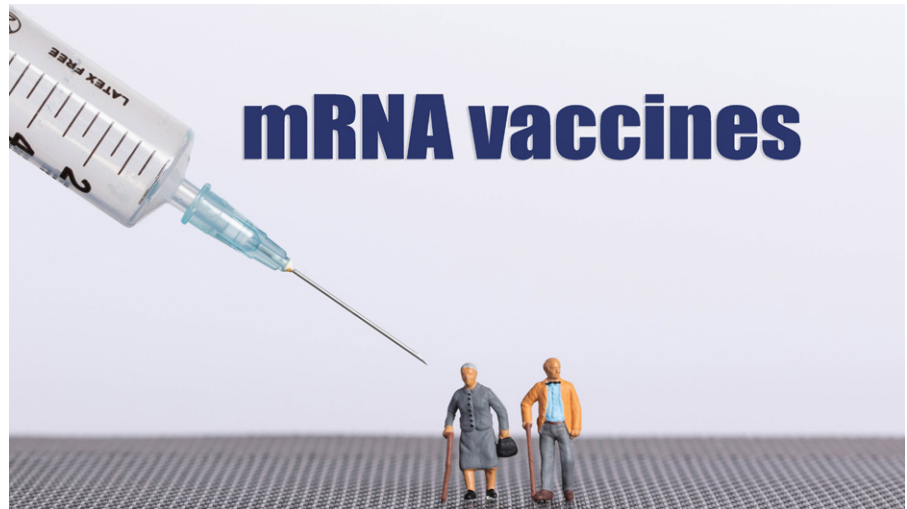
RNA-Impfstoffe gehören zu den genetischen Impfstoffen, da aus der RNA ein Protein hergestellt wird, das eine Immunreaktion auslöst. Foto: cnull / Marco Verch, Lizenz: CC-BY 2.0

CEPI - das sich selbst als „eine Partnerschaft von öffentlichen, privaten, philanthropischen und zivilen Organisationen bezeichnet, die die Entwicklung