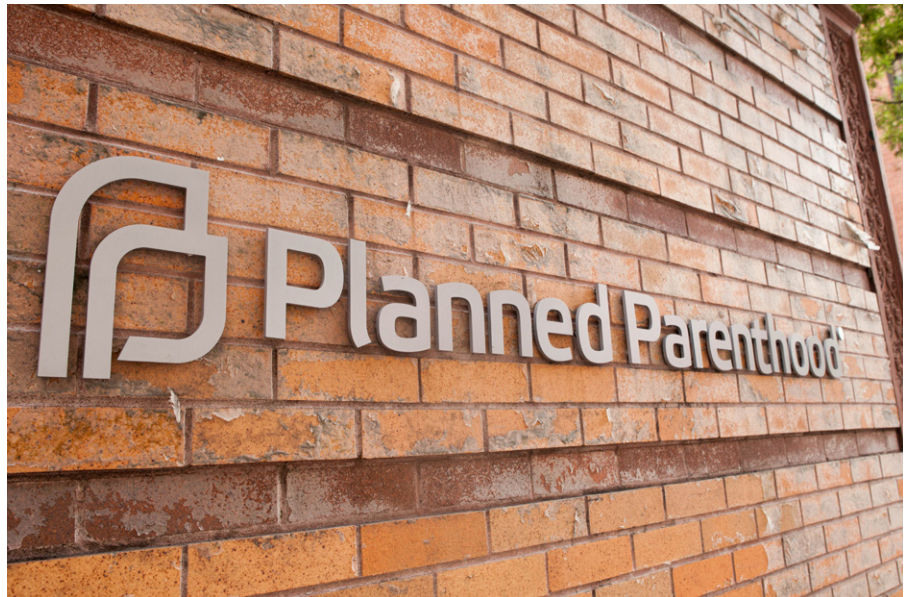
Die Planned Parenthood Federation of America (PPFA), kurz Planned Parenthood (dt. „Geplante Elternschaft“), ist eine amerikanische Non-Profit-Organisation, die in über 650 Kliniken im Land medizinische Dienste, vor allem in den Bereichen Sexualmedizin, Gynäkologie und Familienplanung anbietet.

dere frühe amerikanische Philanthropen an „philanthropische Eugenik“ glauben, also an die Idee, dass sie ihr Geld dazu verwenden könnten, Stiftungen zu gründen, die die Philosophie der Eugenik fördern würden.