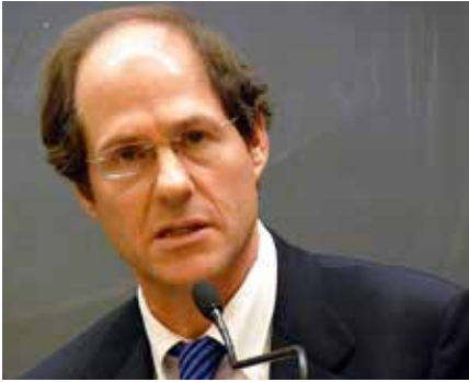
Cass Sunstein hat Jahrzehnte damit verbracht, menschliches Verhalten mit Computersimulationen zu modellieren, um es „wissenschaftlich zu steuern“.