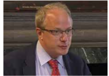
Adrien Vermeule schrieb zusammen mit Cass Sunstein das Buch „Conspiracy Theories“. In dem sie die größte Bedrohung für die herrschende Elite in Form von „Verschwörungstheorien“ darstellen.

Nur um das klarzustellen: Verschwörung bedeutet wörtlich „zwei oder mehr Personen, die gemeinsam in Übereinstimmung mit einer vereinbarten Idee und Absicht handeln“. Die Tatsache, dass Vermeule seine juristische Karriere auf der Argumentation aufbaute, die Gesetze nicht