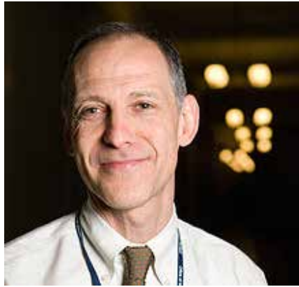
Der US-amerikanische Onkologe und Bioethiker Ezekiel Emmanuel entwarf Obamacare und hofft mit 75 zu sterben. Er setzt sich für eine Bevölkerungs-Kontrolle ein.

Ideologen, die sich für eine Weltregierung [14], die Eliminierung von Kranken und Alten (siehe Obamacare-Architekt