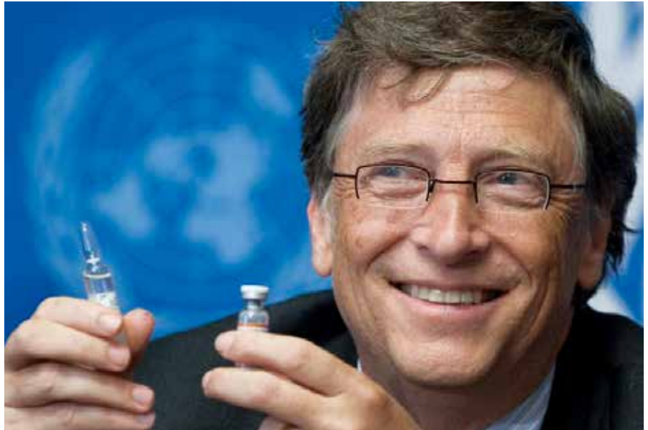
Bill Gates, Co-Vorsitzender der Bill & Melinda Gates Foundation, zeigt während der Pressekonferenz einen Impfstoff. Foto: Flickr / UN Photo / Jean-Marc Ferré, Lizenz: CC BY-NC-ND 2.0