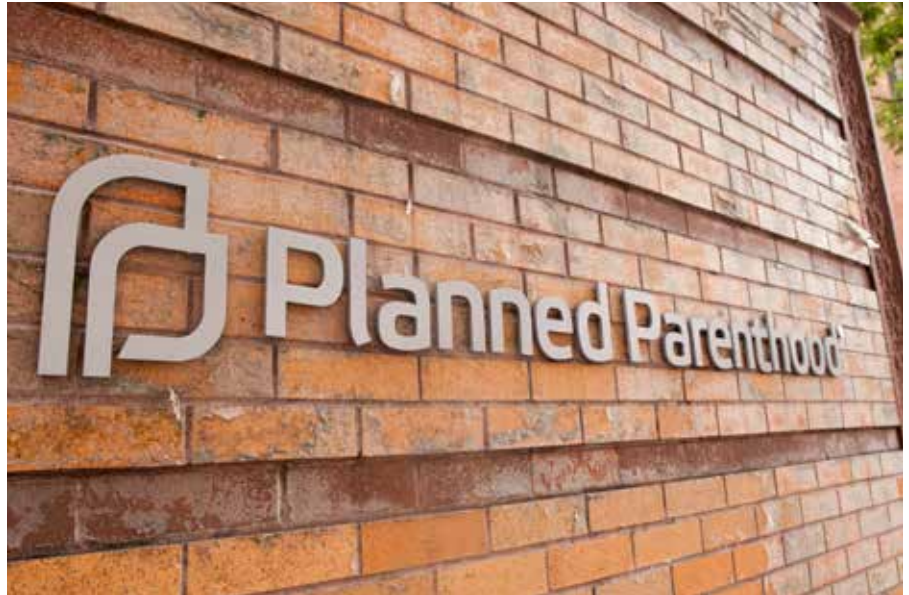
Die Planned Parenthood Federation of America (PPFA), kurz Planned Parenthood (dt. „Geplante Elternschaft“), ist eine amerikanische Non-Profit-Organisation, die in über 650 Kliniken im Land medizinische Dienste, vor allem in den Bereichen Sexualmedizin, Gynäkologie und Familienplanung anbietet.

dere frühe amerikanische Philanthropen an „philanthropische Eugenik“ glauben, also an die Idee, dass sie ihr Geld dazu verwenden könnten, Stiftungen zu gründen, die die Philosophie der Eugenik fördern würden.