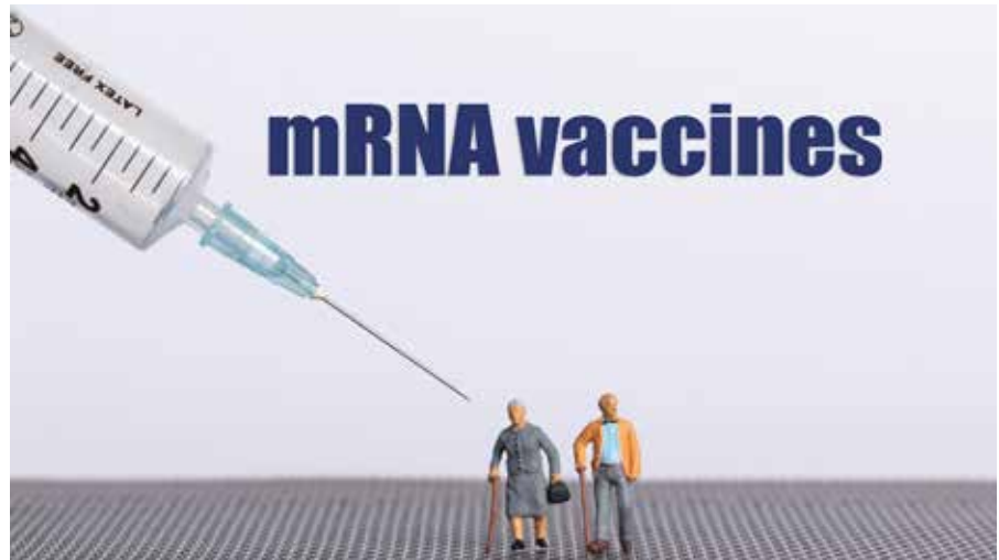
RNA-Impfstoffe gehören zu den genetischen Impfstoffen, da aus der RNA ein Protein hergestellt wird, das eine Immunreaktion auslöst.

CEPI - das sich selbst als „eine Partnerschaft von öffentlichen, privaten, philanthropischen und zivilen Organisationen bezeichnet, die die Entwicklung