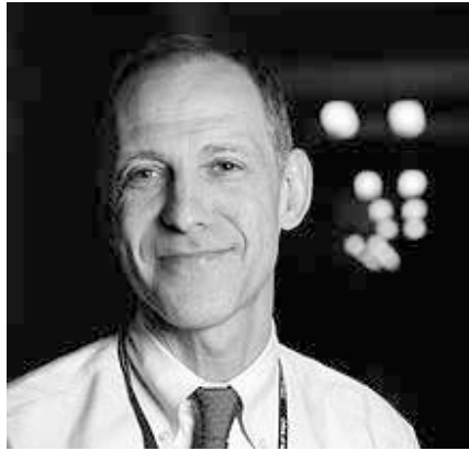
Der US-amerikanische Onkologe und Bioethiker Ezekiel Emmanuel entwarf Obamacare und hofft mit 75 zu sterben. Er setzt sich für eine Bevölkerungs-Kontrolle ein.

Ideologen, die sich für eine Weltregierung [14], die Eliminierung von Kranken und Alten (siehe Obamacare-Architekt