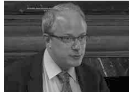
Adrien Vermeule schrieb zusammen mit Cass Sunstein das Buch „Conspiracy Theories“. In dem sie die größte Bedrohung für die herrschende Elite in Form von „Verschwörungstheorien“ darstellen.

Nur um das klarzustellen: Verschwörung bedeutet wörtlich „zwei oder mehr Personen, die gemeinsam in Übereinstimmung mit einer vereinbarten Idee und Absicht handeln“. Die Tatsache, dass Vermeule seine juristische Karriere auf der Argumentation aufbaute, die Gesetze nicht