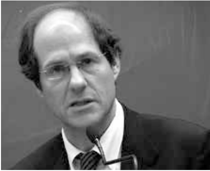
Cass Sunstein hat Jahrzehnte damit verbracht, menschliches Verhalten mit Computersimulationen zu modellieren, um es „wissenschaftlich zu steuern“.