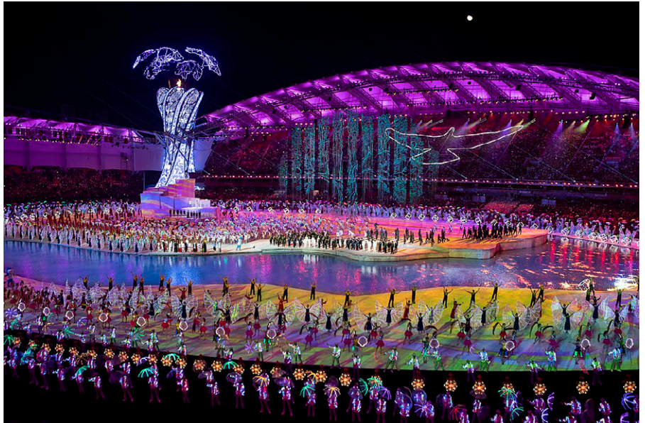
Eröffnungsfeier der 7. CISM Military World Games, die vom 18. bis 27. Oktober in Wuhan stattfanden. Ein ideales Cover für die leise Freisetzung einer hochinfektiösen viralen Biowaffe?

Obwohl der Autor das Fehlen jeglicher belastbarer Beweise betonte, sagte er, dass seine Erfahrung ihn zu dem starken Verdacht geführt habe, dass der Ausbruch des Coronavirus in der Tat ein US-amerikanischer Angriff zur biologischen Kriegsführung gegen China war, der wahrscheinlich von Agenten durchgeführt wurde, die unter dem Deckmantel der Militärspiele, die Ende Oktober in Wuhan stattfanden, ins Land gebracht wurden - die Art von Sabotageoperationen, die unsere Geheimdienste manchmal anderswo durchgeführt hatten. Ein wichtiger Punkt, auf den er hinwies, war, dass eine hohe Letalität bei einer Biowaffe oft kontraproduktiv ist, da die Schwächung oder Hospitalisierung einer großen Anzahl von Menschen einem Land weitaus größere wirtschaftliche Kosten auferlegen kann, als ein biologischer Wirkstoff, der einfach nur eine gleiche Anzahl von Todesfällen verursacht. In seinen Worten: ‚Eine Krankheit mit hoher Kommunizierbarkeit und geringer Letalität ist perfekt, um eine Wirtschaft zu ruinieren‘, was darauf hindeutet, dass die offensichtlichen Eigenschaften des Coronavirus in dieser Hinsicht nahezu optimal waren. Diejenigen, die daran interessiert sind, sollten seine Analyse lesen und selbst seine