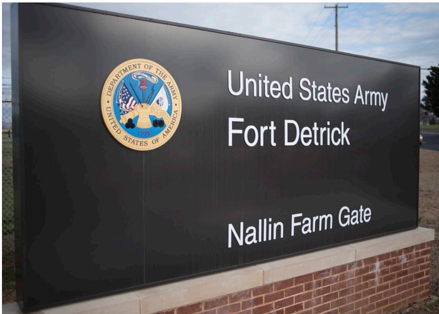
Eingang zu Fort Detrick. Da anti-chinesische Anschuldigungen auf das Labor in Wuhan als wahrscheinlichste Quelle des Virus hingewiesen hatten, revanchierten sich Chinas Anhänger und behaupteten, dass die tödliche Infektion irgendwie aus Ft. Detrick, Amerikas führender Forschungseinrichtung für Biowaffen, entkommen sei.

zu riesigen regionalen Ausbrüchen geführt, einschließlich abertausender Todesfälle, wobei die überlasteten Krankenhäuser Szenen aus Dantes Inferno boten [33]. Hätte sich eine signifikante Anzahl von US-Amerikanern bereits im Spätsommer 2019 infiziert, hätte die daraus resultierende gigantische Epidemie und die riesige Zahl der Todesopfer bis zum Ende des Jahres unsere Schlagzeilen so sehr dominiert, dass niemand den internationalen Entwicklungen aus Wuhan Beachtung geschenkt hätte.