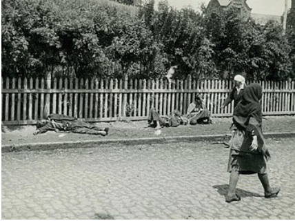
Verhungerte Bauern auf der Straße in Charkow während der Hungersnot in der sowjetischen Ukraine, 1932-1933.

kritisierten Totalitarismen, in welchen das angeblich Gute sehr viele Menschen zu de facto verbrecherischen Handlungen motivierte. Es sind ja nicht in erster Linie Böse, die Böses tun, sondern häufig Gute, die aus Sorge um einen ihrer Überzeugung nach bedrohten und existenziell wichtigen Wert Dinge tun, die letztlich verheerende Folgen haben.