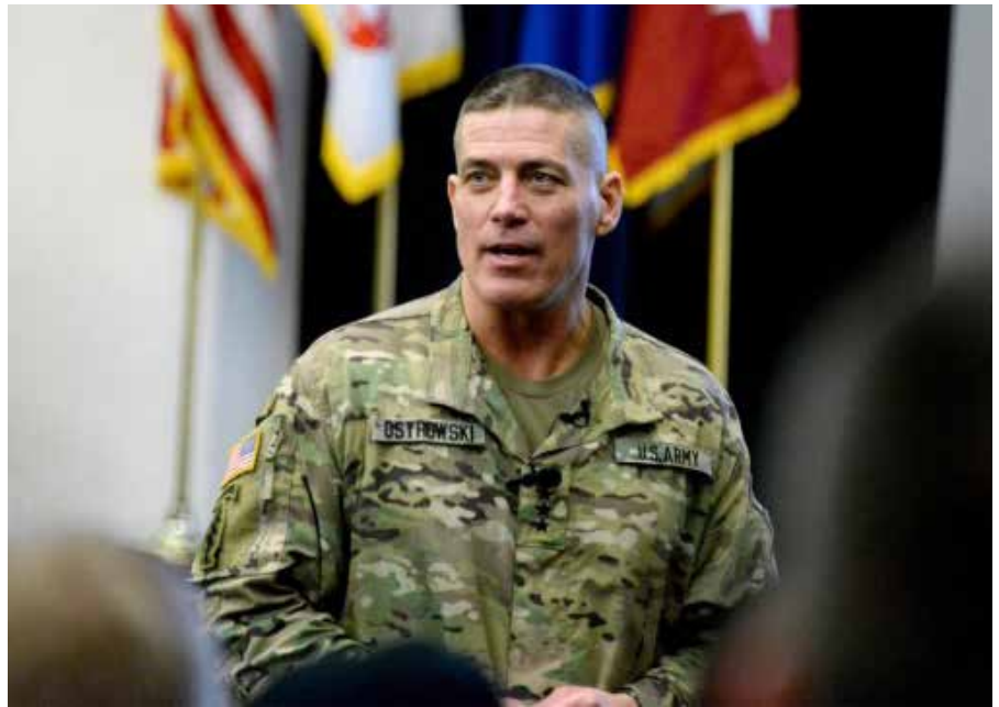
Lt. Gen. Paul Ostrowski ist eine Schlüsselfigur der Operation Warp Speed. Er leitet Lieferung, Produktion und Verteilung von Impfstoffen bei der Operation.