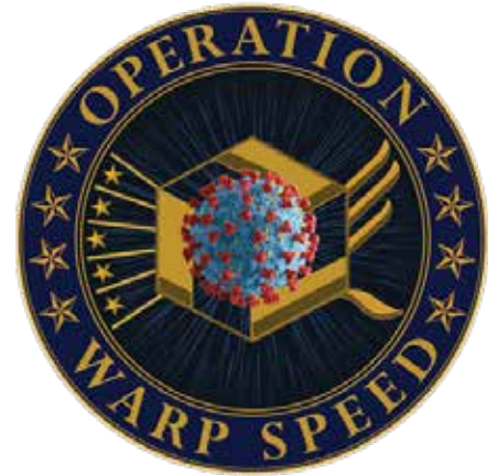
Logo der Operation Warp Speed.

Diese Sorge wird noch verstärkt durch die Tatsache, dass am 21.09.2020 der HHS-Sekretär Alex Azar bei FOX Business folgendes erzählte: Alle an Operation Warp Speed beteiligten Impfstoffhersteller und auch diejenigen, die die Impfstoffe verabreichten, würden von der Haftung für Schäden befreit, die ihre Impfstoffe verursachen können. „Unter dem PREP-Act, einer Bestimmung des Kongresses, ist jede Behandlung oder jeder Impfstoff zur Bekämpfung des Notfalls einer nationalen Pandemie, wie dieser, tatsächlich mit einem Haftungsschutz ausgestattet. Sowohl für das Produkt als