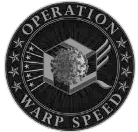
Logo der Operation Warp Speed. (Logo: US-Verteidigungsministerium / Wikipedia / CCo)

Diese Sorge wird noch verstärkt durch die Tatsache, dass am 21.09.2020 der HHS-Sekretär Alex Azar bei FOX Business folgendes erzählte: Alle an Operation Warp Speed beteiligten Impfstoffhersteller und auch diejenigen, die die Impfstoffe verabreichten, würden von der Haftung für Schäden befreit, die ihre Impfstoffe verursachen können. „Unter dem PREP-Act, einer Bestimmung des Kongresses, ist jede Behandlung oder jeder Impfstoff zur Bekämpfung des Notfalls einer nationalen Pandemie, wie dieser, tatsächlich mit einem Haftungsschutz ausgestattet. Sowohl für das Produkt als