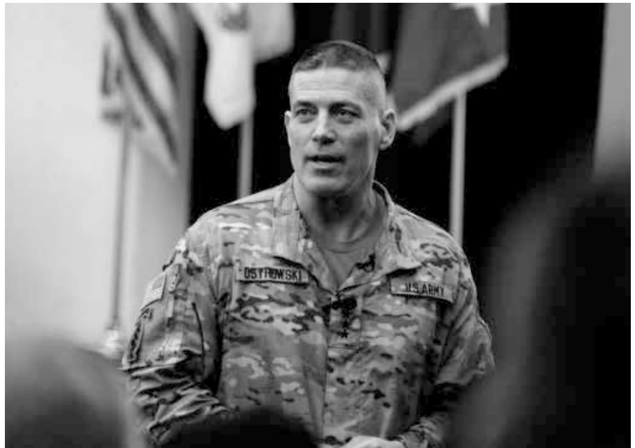
Lt. Gen. Paul Ostrowski ist eine Schlüsselfigur der Operation Warp Speed. Er leitet Lieferung, Produktion und Verteilung von Impfstoffen bei der Operation.