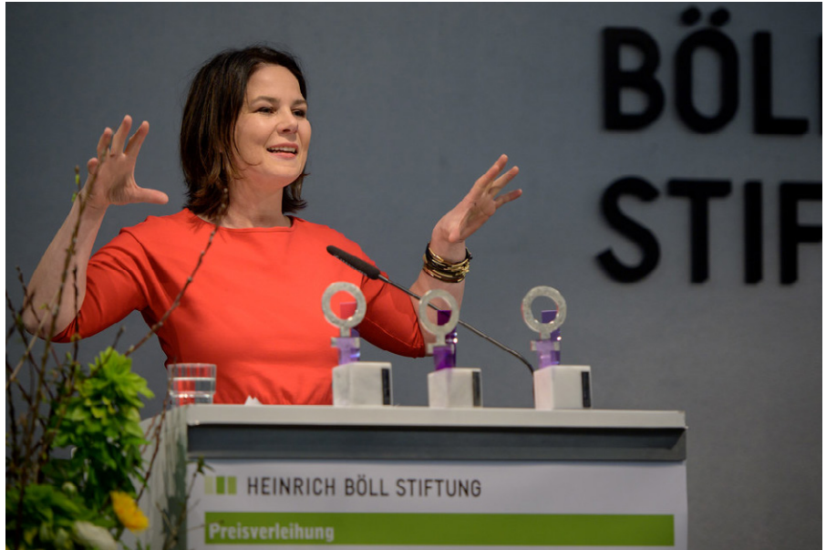
Annalena Baerbock hält eine Rede bei der Heinrich-Böll Stiftung.

Dieser Text wurde zuerst am 24.04.2021 auf www.de.rt.com unter der URL https://de.rt.com/meinung/116402-annalena-baerbock-harte-und-dialog/ veröffentlicht. Lizenz: © Leo Ensel, RT DE